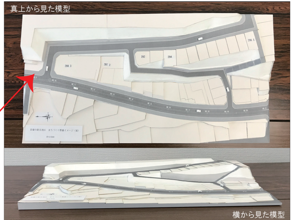
図2 まちづくり整備イメージ(案)の簡易模型

この模型は鈴蘭台相談所に置いてありますので、興味のある方は相談所にお越しいただき、ご覧ください。