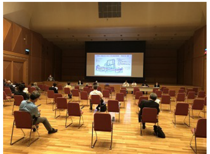
神戸市による土地区画整理事業(案)の説明の様子