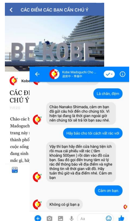
Facebook ページと 双方向コミュニケーション