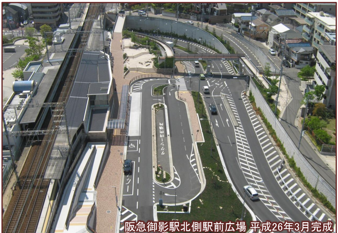
阪急御影駅北側駅前広場 平成26年3月完成