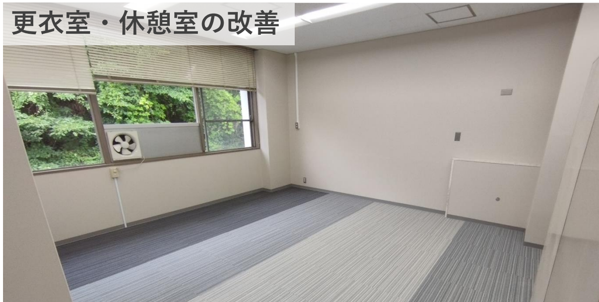
更衣室・休憩室の改善