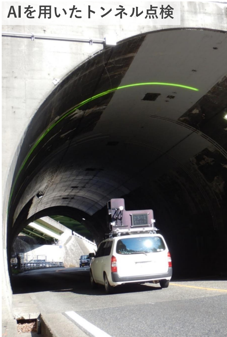
AIを用いたトンネル点検