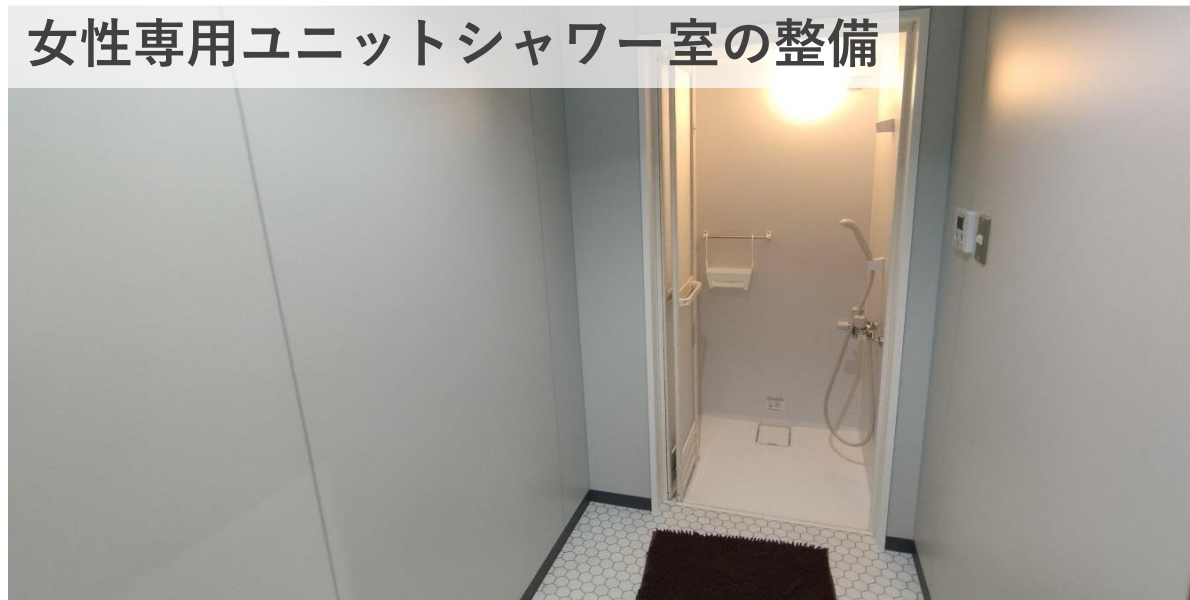
女性専用ユニットシャワー室の整備