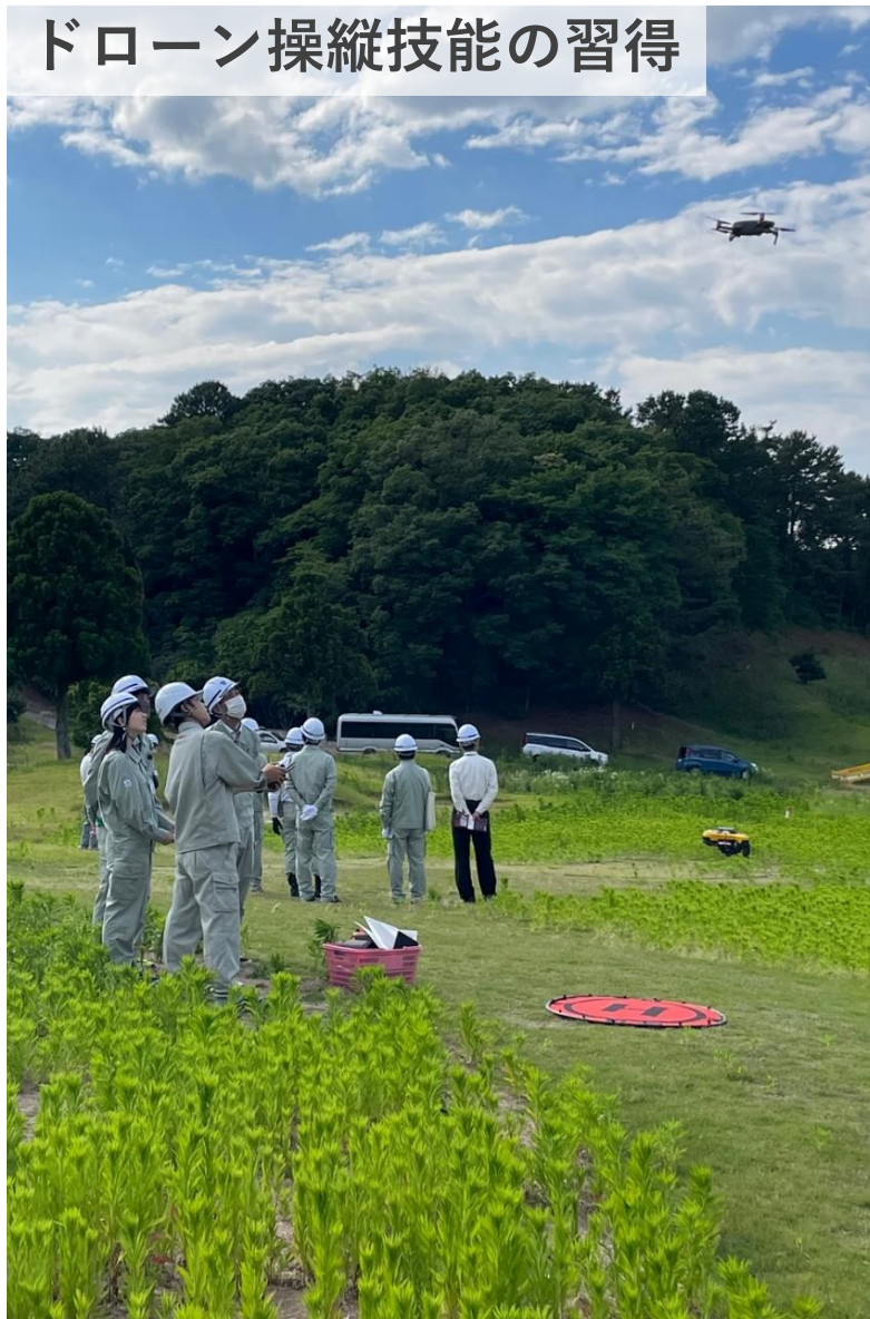
ドローン操縦技能の習得