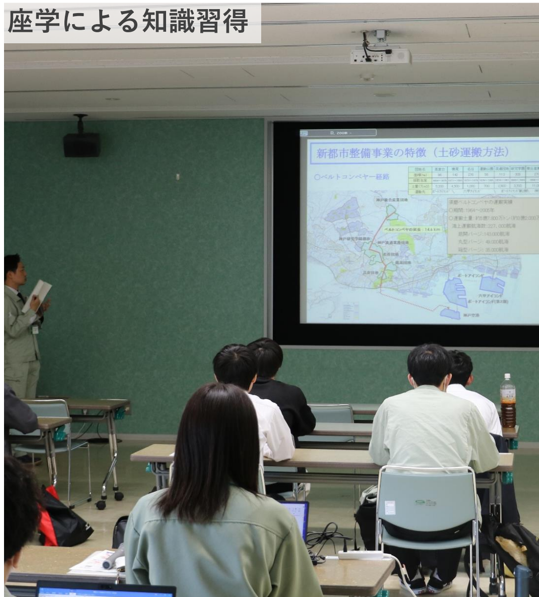
座学による知識習得