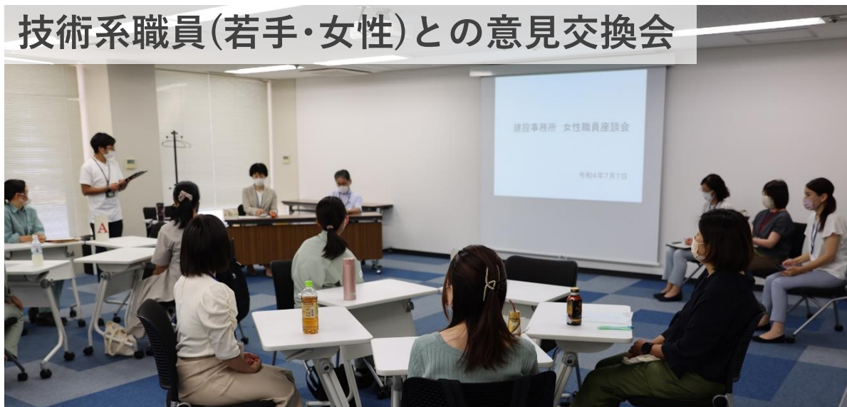
技術系職員(若手・女性)との意見交換会