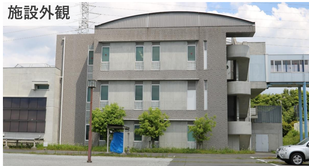
施設に併設する研修フィールド