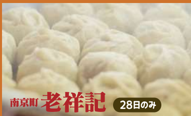
南京町 老祥記 28日のみ

森谷商店 神戸ワインビーフの焼肉・神戸南京町 元祖豚饅頭 老祥記の豚まん・神戸市西区の人気古民家カフェ「RAWZEN FARMS CAFE」のデリプレートBOXなど。人気のキッチンカーもやって来ます♪