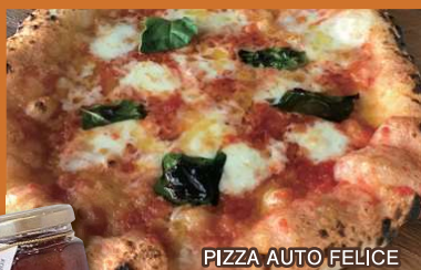
PIZZA AUTO FELICE