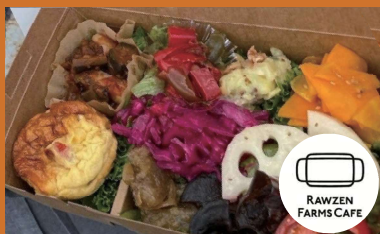
RAWZEN FARMS CAFE