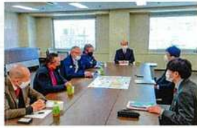
2024年問題と現状について意見を交換する松本市議(兵庫県トラック協会海上コンテナ部会 皆さんと)

働き方改革関連法により、2024年4月1日よりトラックドライバーの時間外労働時間の上限規制が適用されることによる物流への影響が懸念されます。いわゆる「2024年問題」が注目されており、2024年問題については、特に神戸港において、サプライチェーンに混乱が生じ、神戸港の港勢、ひいては神戸経済へ悪影響を及ぼすのではないかと懸念をされているところでもあります。