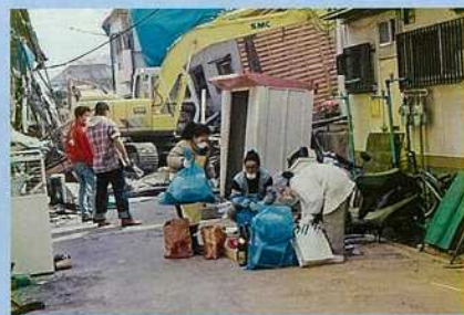
南須磨の生まれ育った実家が全壊！思い出の品を家族でひろい集める