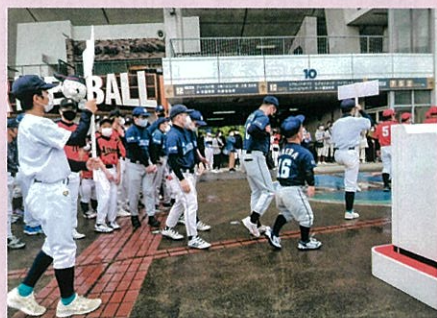
全国から参加16チーム入退場行進は小雨模様での開会式でした。 (ホットモット球場にて)