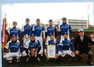
神戸軟式野球協会会長として全神戸選抜軟式野球大会で優勝したエムスペースボールクラブチームに優勝旗を授与する(G7球場にて)