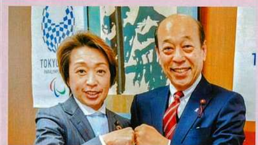
橋本聖子参院議員に子育て支援や神戸2024世界パラ陸上競技大会について要望する