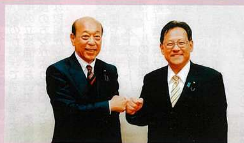
関芳弘衆院議員に地元施策について予算要望する