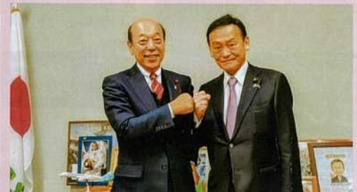
前文部科学大臣・末松信介参院議員にスポーツ支援等を要望する