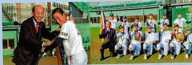
KSBL秋季大会・松本しゅうじ旗争奪少年・少女野球大会で優勝した花谷少年野球部に優勝旗を授与・激励する松本市議(G7球場にて)