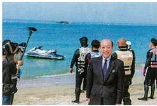
海上安全パトロール講習会を視察する松本市議

須磨海岸の沖合でも、SUPやウィンドサーフィンが不可抗力で沖に流された事例もあり、マリニピアを楽しむため、海域の安全・安心を守るために活動する団体の役割は非常に重要であるというふうに考えてございまして、そういった団体の活動拠点を設けることについて、今後、検討してまいりたいというふうに考えてございます。