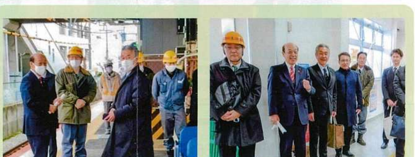
山陽電鉄技術部長・兵庫県都市政策課長・神戸市障害福祉課長から 工事完了の説明を聞く(ホームと駅舎にて)