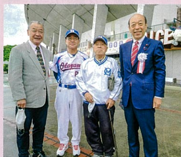
福本豊(元プロ野球選手) 名譽理事長と共に役員の方々に激励。