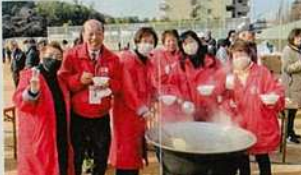
北須磨団地左義長で焼き出しをする婦人会皆様の活動に感謝と激励をする松本市議(多井畑小学校にて)