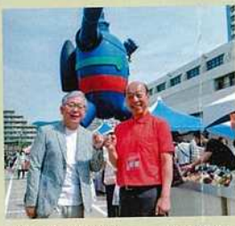
日本ケミカルシューズ工業組合主催「くつまつり」で地場産業を支援する河野副理事長と組合相談役の松本市議(新長田鉄人広場にて)