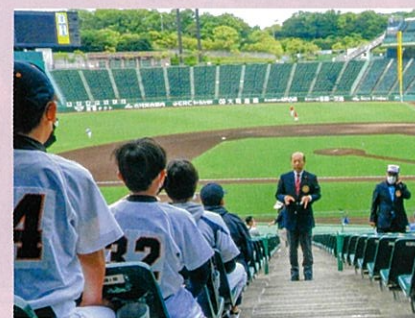
地元学童野球チームを招待し、始球式前にスタンドで待機するチームの皆さんへ健康な体に感謝して野球を楽しんで下さいと激励する。