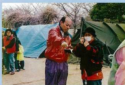
被災されたtent暮らしの方々の要望を聞く／妙法寺川公園にて