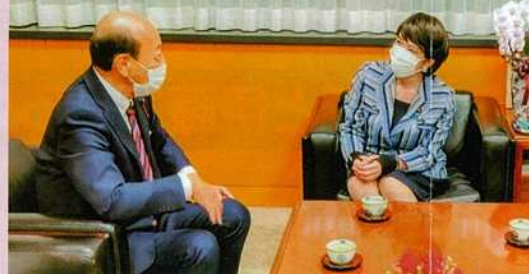
経済安全保障担当大臣・高市早苗衆院議員と共に地方創生やサプライチェーン対策等々について懇談する