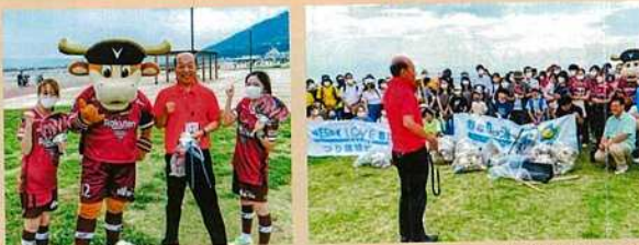
須磨海岸クリーン作戦参加のボランティアの皆さんに激励挨拶する松本市議(関衆院議員・ヴィッセル神戸モーヴィと共に頑張る)