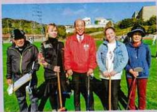
ウクライナ支援として、グラウンドゴルフ大会に神戸に避難されたご家族を招待し、参加チームの方々との親睦と支援金活動に取り組む松本市議(左川さん・原田さんと共にプレーする・総合運動公園にて)