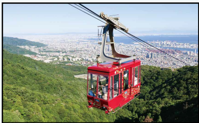
Số 8: Núi Maya (Quận Nada)