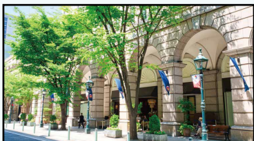
Số 9: Phố nhà cổ (Quận Chuo)