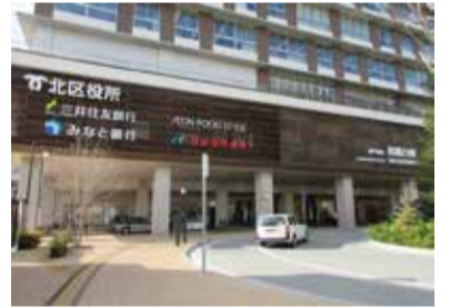
▲現在の鈴蘭台駅前