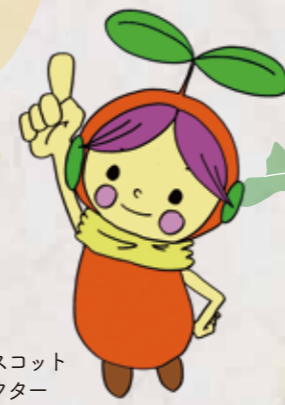
北区マスコット キャラクター キタールさん