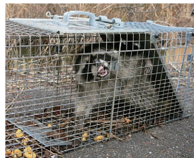
有害鳥獣・外来生物対策

利子所得として20.315%(所得税・復興特別所得税 15.315%+地方税 5%)が課税されます。