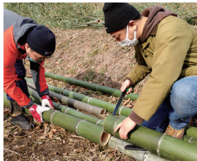
多井畑西地区の里山保全・活用

下記の取扱金融機関にてご購入いただけます。(神戸市役所では販売していません) ご購入の際には、必要な手続きが各金融機関によって異なる場合があります。 口座管理手数料等が必要となる場合がありますので事前に取扱金融機関にご確認ください。