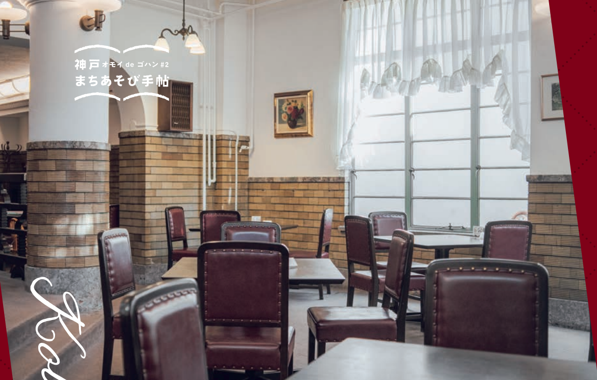
神戸オモイデゴハン#2 まちあそび手帖