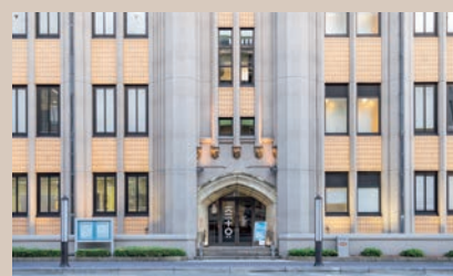
港の繁栄と歴史を継ぐ文化施設