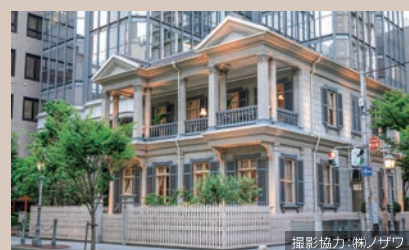
現存する神戸最古の洋館