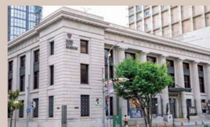
堂々たる旧居留地のランドマーク