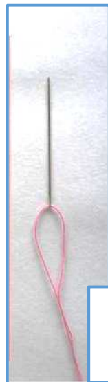
針と糸をご用意ください (糸の色は問いません)