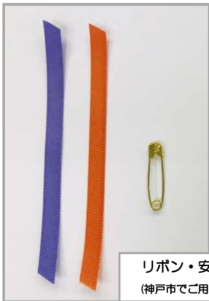
リボン・安全ピン (神戸市でご用意します)