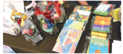
※当日販売している商品は、写真と異なる場合がございます

区内の障がいのある人たちが働く事業所で作られたお菓子や小物などを販売します。ぜひお越しください。 日時 7月22日⑨10:30~15:00 会場 御影クラッセ2階 エスカレーター横 ☎451-3760 ㊟451-3761