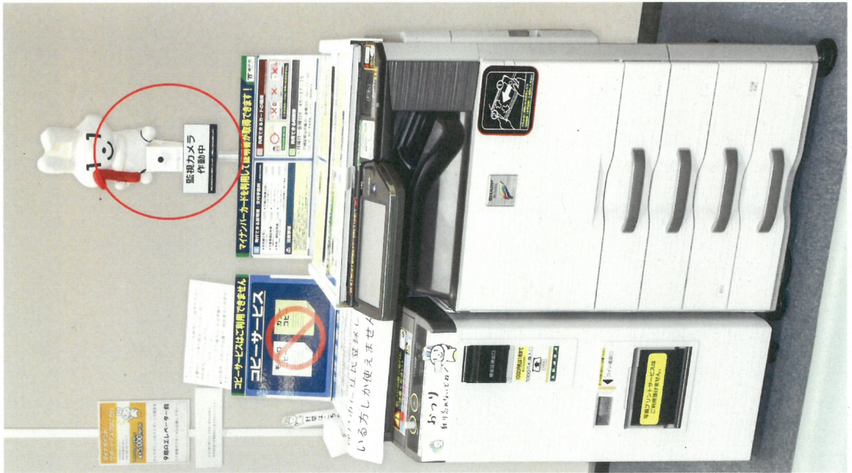
図：キオスク端末全体の画像（中央区）