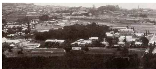
【1915年（大正4年）頃の原田の森】