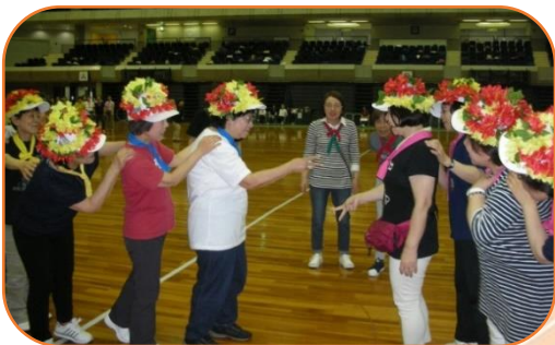
ジャンケンむかで ジャンケンぽん! 勝てばチャンピオン