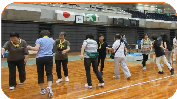
フォークダンス 青春時代にタイムスリップ 心はおとめ ♪