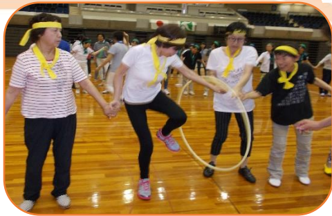
フラ輪一送り 足入れて ヨイショ!