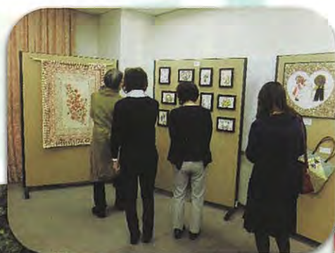
平成28年11月5日 学園祭