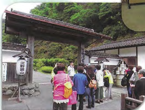
平成28年5月24・25・26日 歓迎交流会