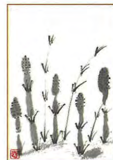
絵てがみクラブの作品