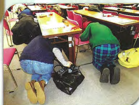
平成29年1月17日 シェイクアウト訓練