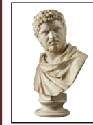
「カラカラ帝胸像 212-217年」