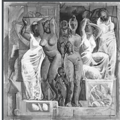
大作の構想? 《群像》バスル 水彩・紙 1973年