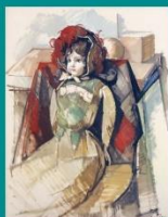
小磯良平《フランス人形》1964年 油彩・紙 神戸市立小磯記念美術館蔵

KOBE CITY KOISO MEMORIAL MUSEUM OF ART 神戸市立小磯記念美術館 Kobe City Koiso Memorial Museum of Art