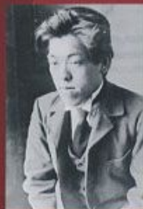
上京直後の好太郎 1921

主催：神戸市立小磯記念美術館、産経新聞社 後援：神戸新交通株式会社、NHK神戸放送局