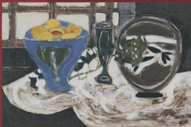
三岸節子《静物(金魚)》1960 東京国立近代美術館蔵 ©MIGISHI