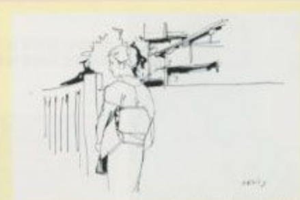
小磯良平『(連載期) 第7回 1966 本館蔵』