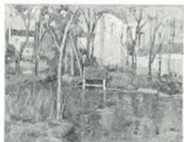
「グレー、フォンテンブロー村」1993 個人展