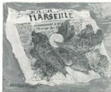
「ラスカスの魚」1981 個人展