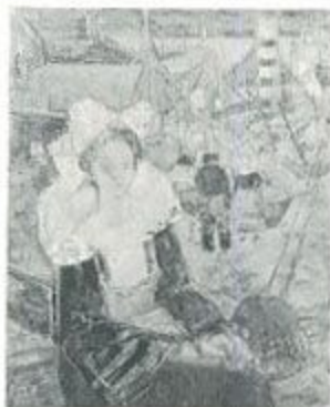
「ブルーベリー少女」1966 個人展