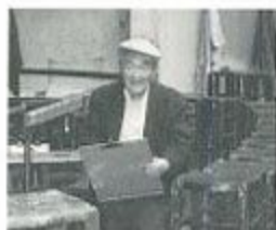
1997年3月 パリ、アカデミー・ドーランド・シヨールとヌールにて