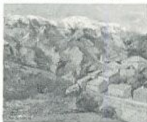
「プロヴァンス（プラント村より見たモンザントゥ）」1986 個人展