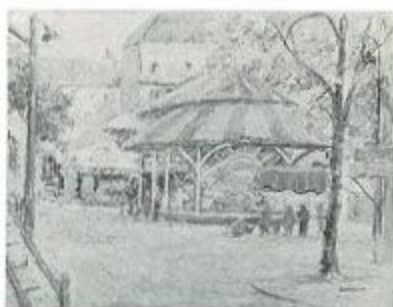
「マネージュ パリ」1965 個人展

このたび本館で開催する展覧会は、油彩、素描あわせて118点により、関口俊吉の画業を紹介しようとするものです。これまで、故郷の神戸において、こうしたまとまった数の作品が展示されたことはなく、本展が初めての試みとなります。パリに永く暮らす画家のエスプリを、作品から受け取ってみられてはいかがでしょうか。