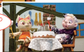
だっただっのおばあさん