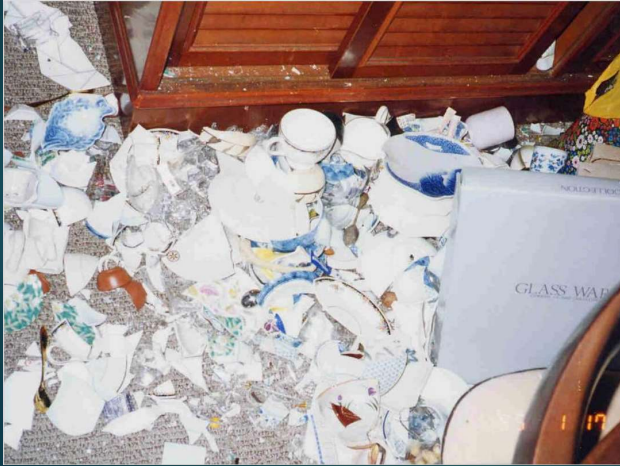
地震後の家の中の様子