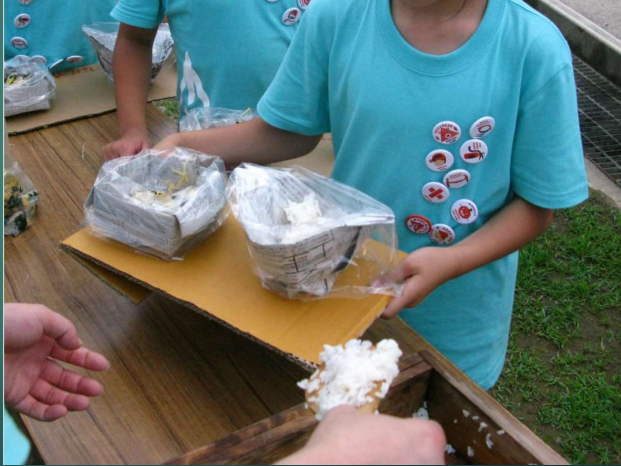
水は貴重で洗い物で使える水の確保が大変でした。