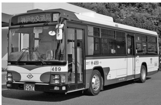
いすゞ大型ロングワンスレLV234N2 平成19年式 ジェイ・バス