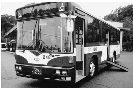
UD大型ワンステUA452KAN 平成15年式 西日本車体