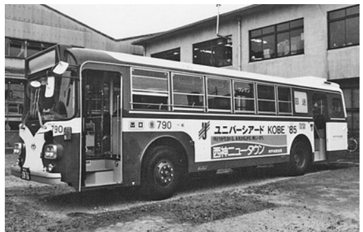
日野K-RC381 昭和58年式 日野車体