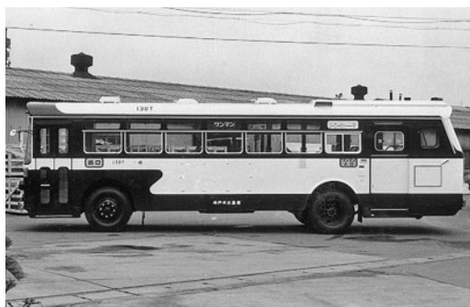
ふそうMR410 昭和48年式 西日本車体