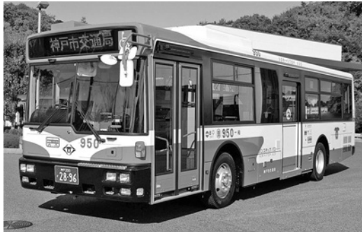
UD大型ノンステRA273KAN 平成20年式 西日本車体