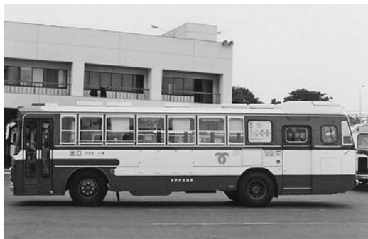
三菱K-MP118 昭和55年式 三菱名古屋自動車製作所