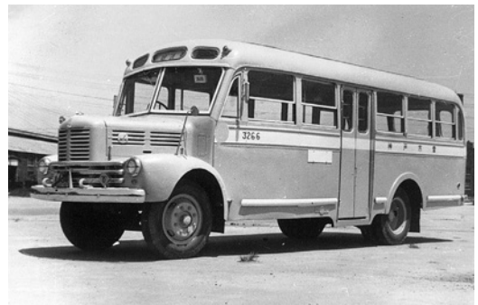
いすゞBX91 昭和26年式 44人 新日国工業