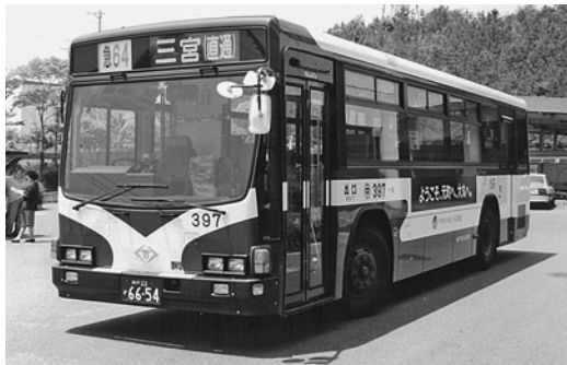
いすゞKC-LV280L 平成10年式 いすゞバス製造