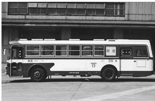
日野RE100 昭和52年式 日野車体