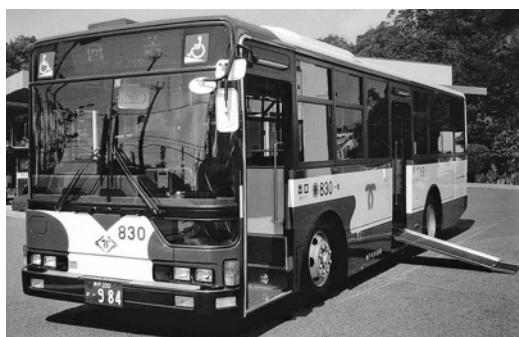
三菱大型ワンステMP35JK 平成14年式 三菱自動車バス製造