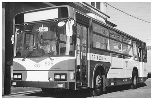
日野U-HU 3 KLA 平成5年式 日野車体