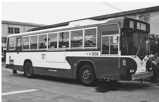
日野U-HT 2 MLAA 平成2年式 西工車体