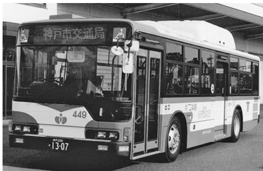
三菱大型CNGノンステMP37JK 平成16年式 三菱自動車バス製造