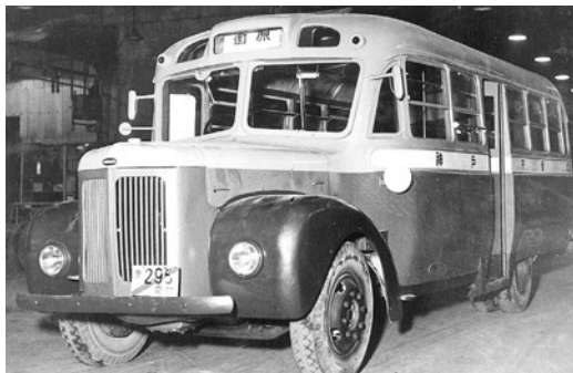
民生3L 昭和24年式 47人 新三菱重工業