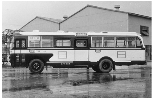
日野RB10 昭和42年式 金産自動車