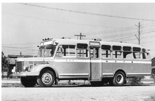
日野BH11 昭和29年式 62人 新日国工業