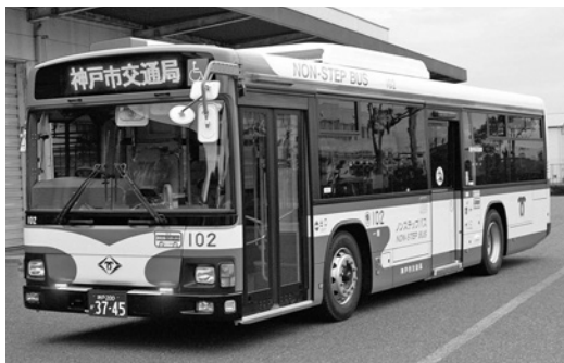
日野大型ノンステKV234L3 平成23年式 ジェイ・バス