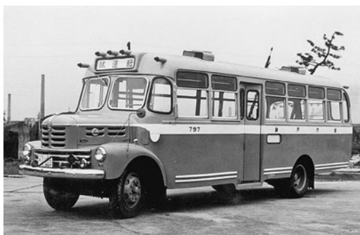
いすゞBX95-7 昭和29年式 54人 摂津車両