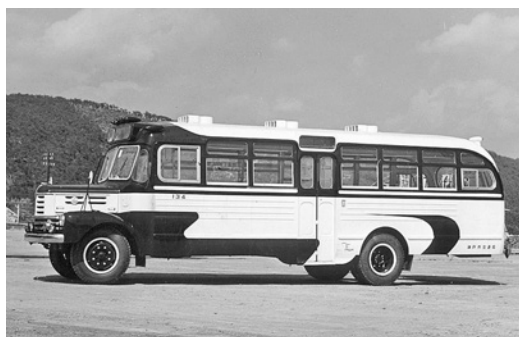
いすゞBX351 昭和32年式 64人 川崎航空機