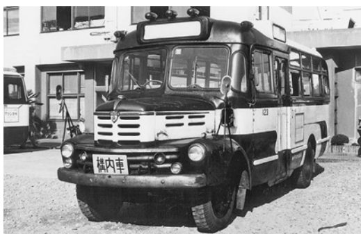
神戸市交通局に残ったただ1両のボンネットバス