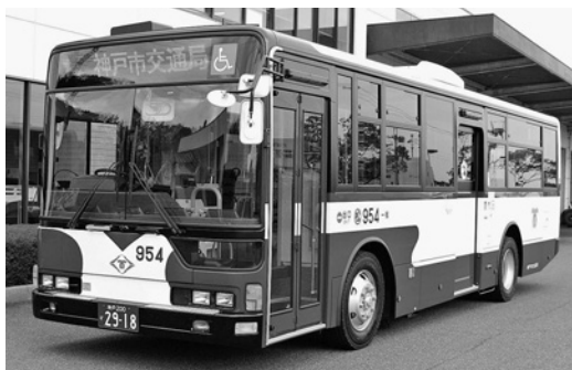
三菱大型ワンステMP35UK 平成20年式 三菱自動車バス製造