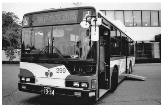
三菱大型CNGノステMP37JK 平成17年式 三菱ふそうバス製造