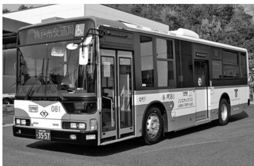
三菱大型ノンステMP37FK 平成23年式 三菱ふそうバス製造