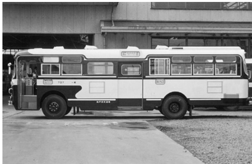
日野RB10 昭和41年式 帝国自動車