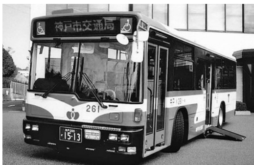
UD大型ノステUA452KAN 平成16年式 西日本車体