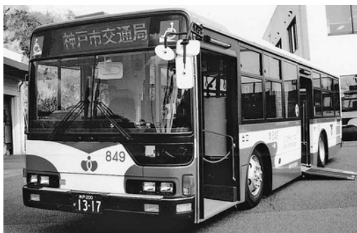
三菱大型ノンステMP37JK 平成16年式 三菱自動車バス製造