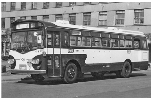
ふそうMR410 昭和46年式 三菱自動車