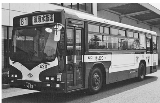
いすゞKC-LV280L 平成12年式 いすゞバス製造