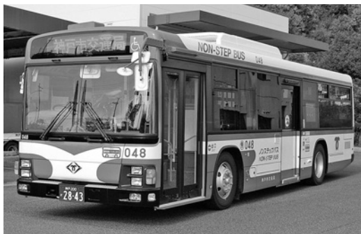
いすゞ大型ノンステLV234L 2 平成20年式 ジェイ・バス