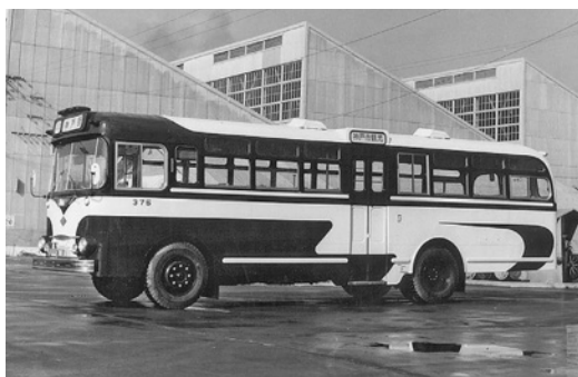
昭和35年式日野AC型 座席仕様