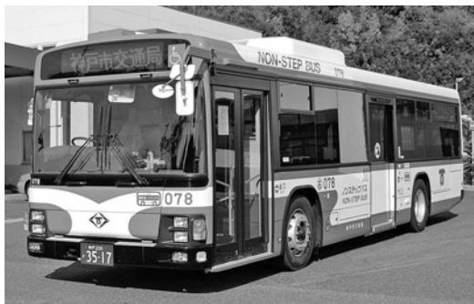
いすゞ大型ノンステLV234L3 平成22年式 ジェイ・バス