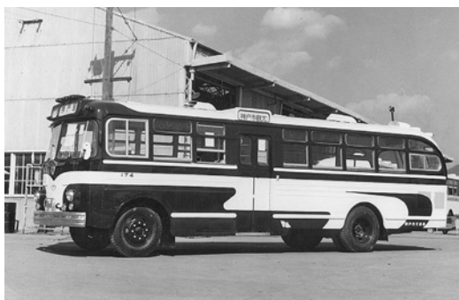
昭和34年式いすゞセミロマンス 66人乗り