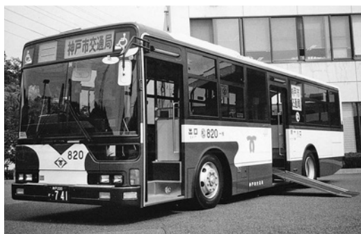
三菱大型ワンステMP35JK 平成13年式 三菱自動車バス製造