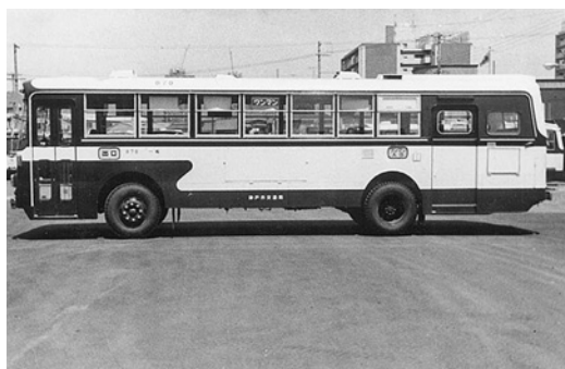
日野RE100 昭和48年式 金産自動車