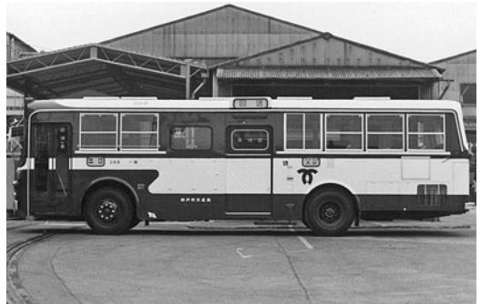
いすゞK-CJM470 昭和56年式 川重車体