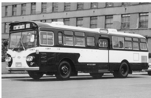
三菱MR410 昭和47年式 三菱自動車