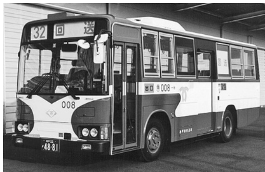
三菱U-MK517F 平成4年式 新呉羽自動車工業