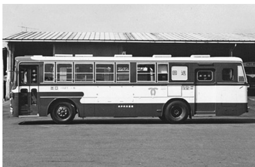
三菱MP107 昭和53年式 三菱名古屋自動車製作所