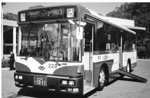
UD大型ワンステUA452KAN 平成14年式 西日本車体