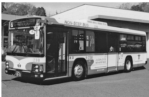
いすゞ大型ノンステLV834L 1 平成14年式 いすゞバス製造