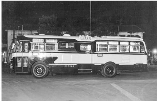
日野RB10 昭和41年式 富士重工業