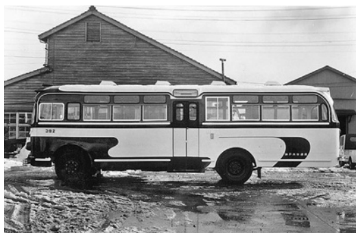
日野BD35 昭和36年式 金沢産業