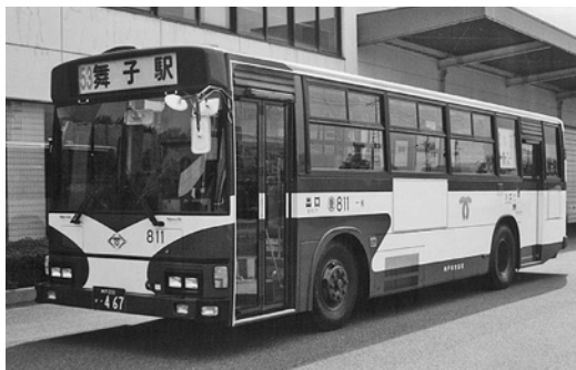
日野KC-HU 3 KLC 平成12年式 日野車体