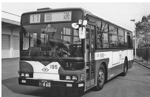
三菱KC-MP717K 平成12年式 三菱自動車バス製造