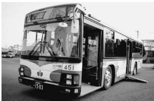
いすゞ大型ノンステLV280L 1 平成16年式 いすゞバス製造