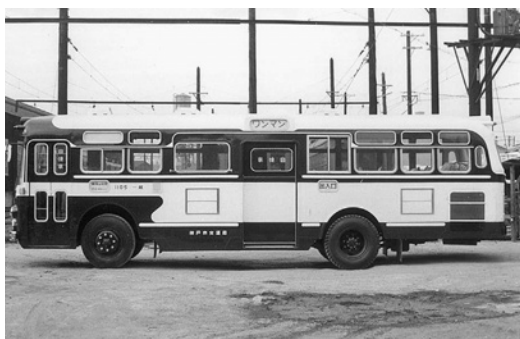
ふそうMR480 昭和40年式 西日本車体