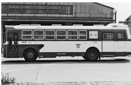
日野RE101 昭和54年式 西工車体