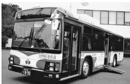
いすゞ大型ノステLV234L1 平成17年式 ジェイ・バス