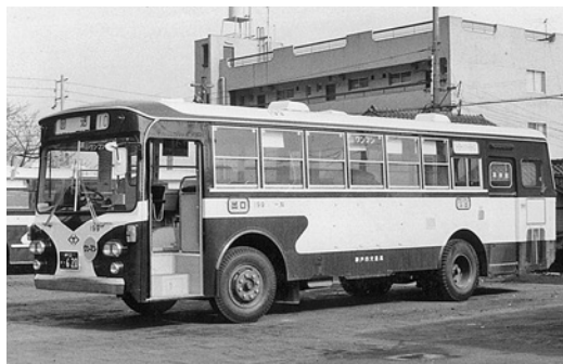
いすゞBU04 昭和48年式 川崎重工