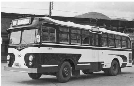
昭和34年式ふそうセミロマンス 72人乗り