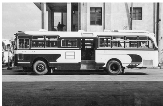
日野RB10 昭和37年式 帝国自工