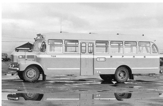
いすゞBX95 昭和28年式 54人 川崎岐阜製作所