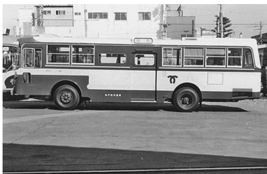
日野RE100 昭和51年式 日野車体