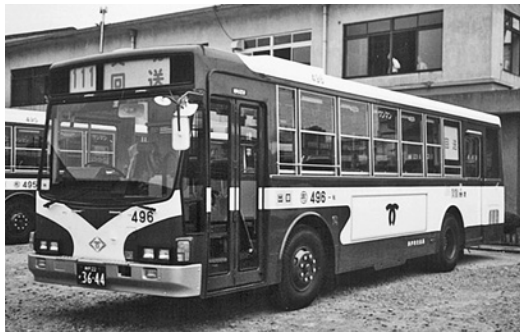
いすゞP-LV314K 昭和61年式 川重車体