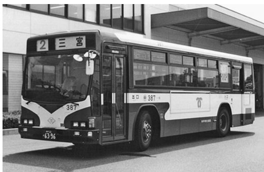
いすゞKC-LV280L いすゞバス製造