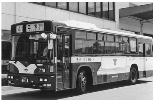
日野KC-HU3KLC 平成9年式 西工車体