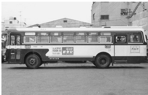
日野RE100 昭和46年式 帝国自工