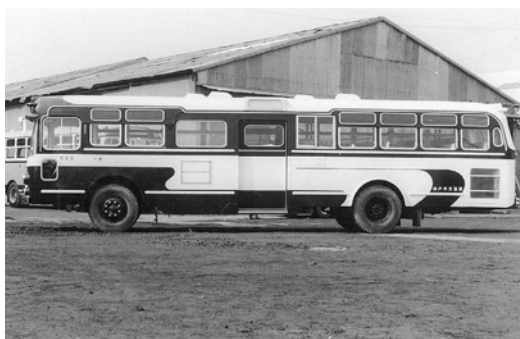
ふそうMB470 昭和38年式 東新浦自工 (西工)