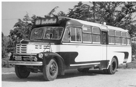
いすゞBX352 昭和32年式 58人 呉羽東浦重工