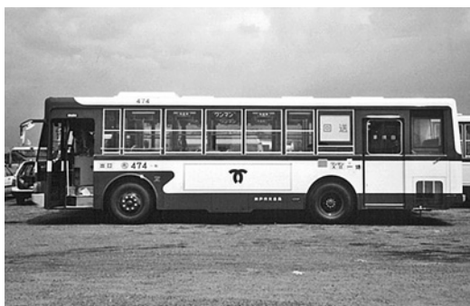
いすゞP-LV314K 昭和60年式 川重車体