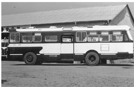
日野RE100 昭和45年式 西日本車体