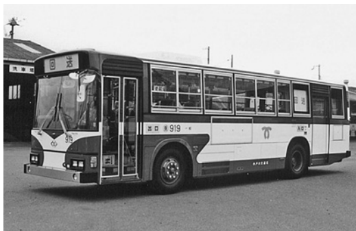
三菱U-HU 2 MLAA 平成3年式 日野車体