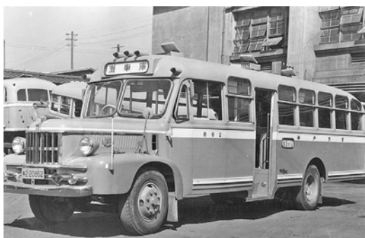
ふそうB25 昭和29年式 65人 新日国工業