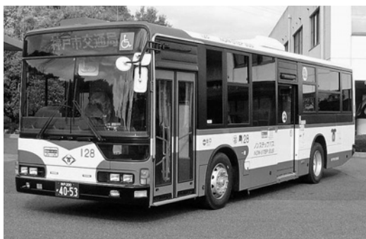
三菱大型ノンステMP37FK 平成24年式 三菱ふそうバス製造