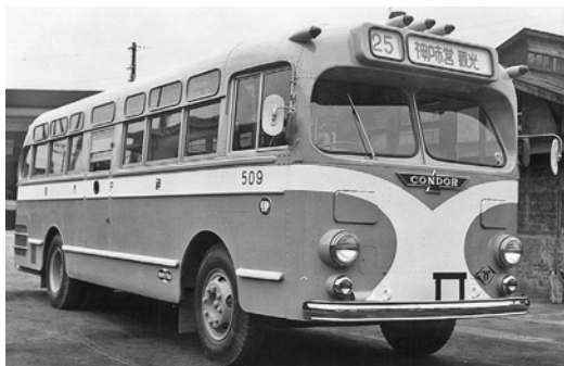
昭和31年式民生セミロマンス 58人乗り