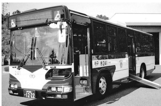
日野大型ワンステHU 2 PLEA 平成15年式 日野車体