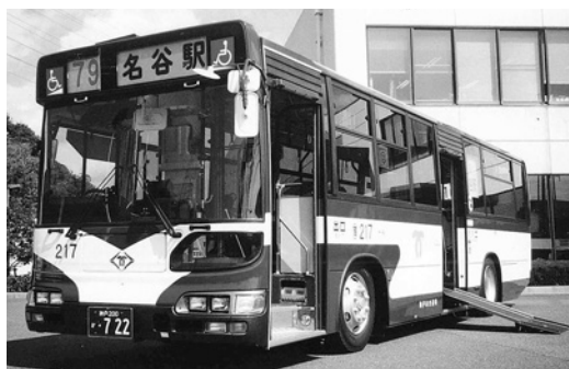
日野大型ワンステHU 2 PLEA 平成13年式 日野車体