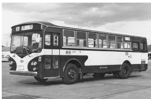
いすゞBU 昭和49年式 川崎重工