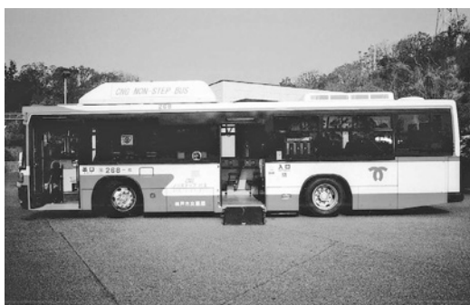
UD大型CNGノステUA272KAN 平成16年式 西日本車体