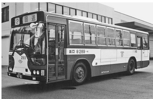
三菱U-MP618K 平成3年式 三菱名古屋自動車製作所