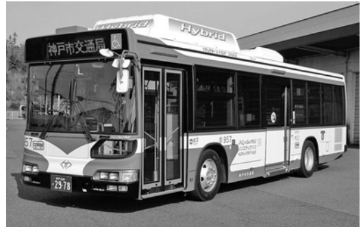
日野大型ハイブリッドノンステHU8 JLFP 平成21年式 ジェイ・バス