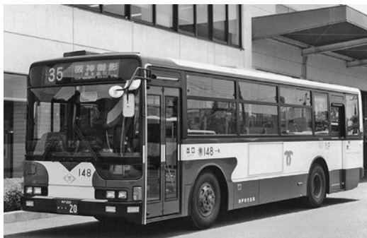
三菱KC-MP717K 平成10年式 三菱自動車バス製造