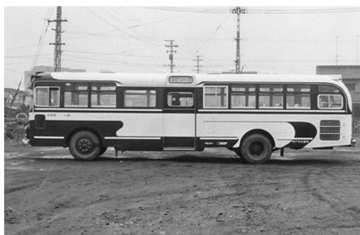
ふそうR470 昭和37年式 呉羽自工