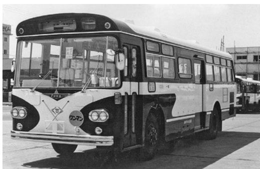
三菱MR410 昭和44年式 西日本車体