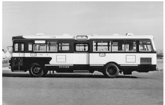
ふそうMR410 昭和42年式 三菱重工業