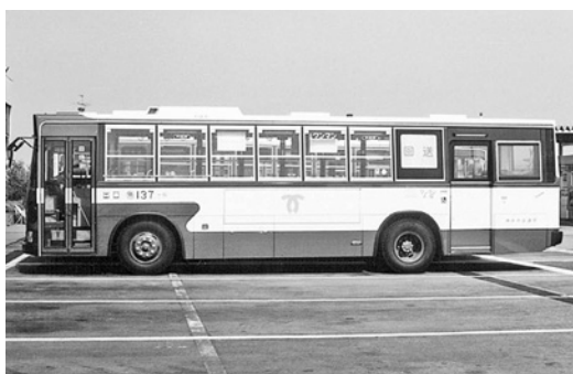
三菱P-MP218K 昭和60年式 三菱名古屋自動車製作所