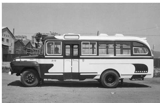
いすゞBX721 昭和36年式 44人 川崎航空機