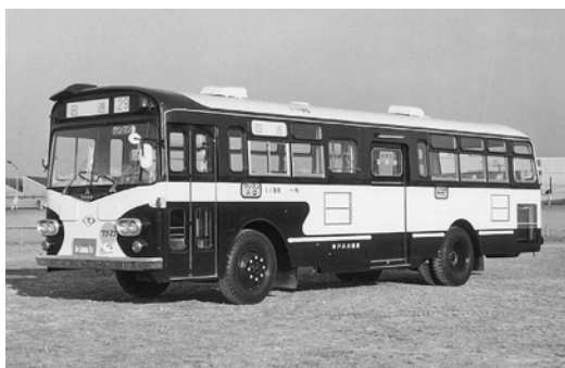
三菱MR410 昭和44年式 三菱重工業