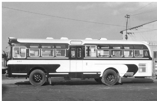
ふそうR480 昭和36年式 東浦自工