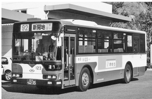
三菱KC-MP717K 平成8年式 三菱自動車バス製造