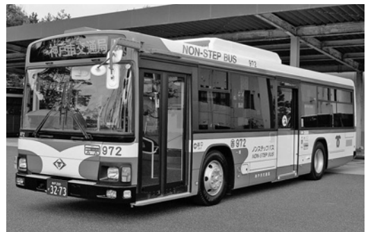
日野大型ノンステKV234L 2 平成22年式 ジェイ・バス