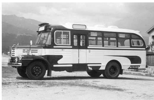
いすゞBX331 昭和34年式 38人 川崎航空機