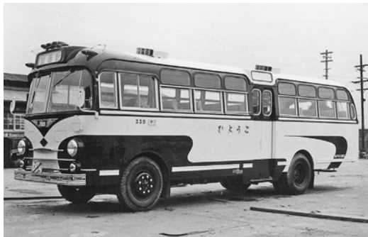
昭和32年式日野「ひようご号」 61人乗り