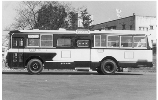
日野RB10 昭和42年式 川崎航空機