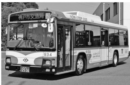
日野大型ノンステKV234L2 平成19年式 ジェイ・バス