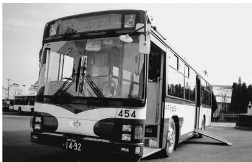
いすゞ大型ワンステロングLV280N1 平成16年式 いすゞバス製造