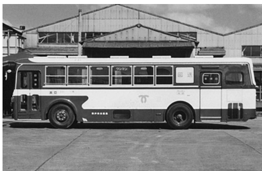
いすゞBU04 昭和53年式 川重車体