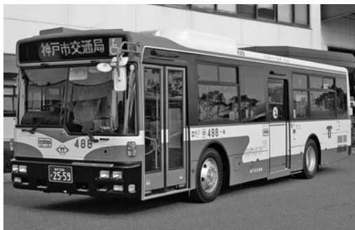
UD大型ノンステRA273KAN 平成19年式 西日本車体