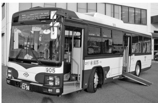
日野ワンスレKV234L1 平成18年式 ジェイ・バス