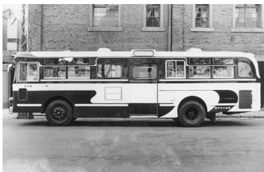
いすゞBR20 昭和38年式 川崎航空機