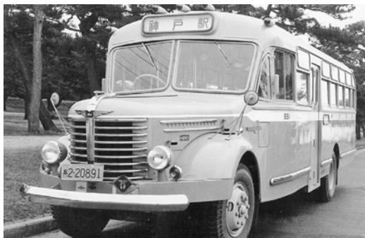
日野BH11 昭和29年式 64人 金沢産業