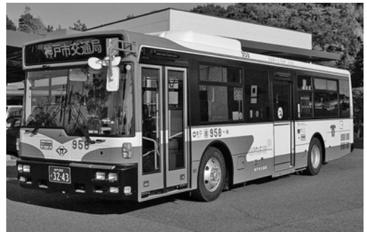
UD大型ノンステRA273KAN 平成21年式 西日本車体