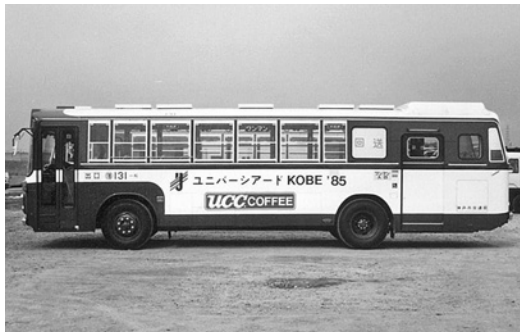
三菱P-MP118K 昭和59年式 三菱名古屋自動車製作所