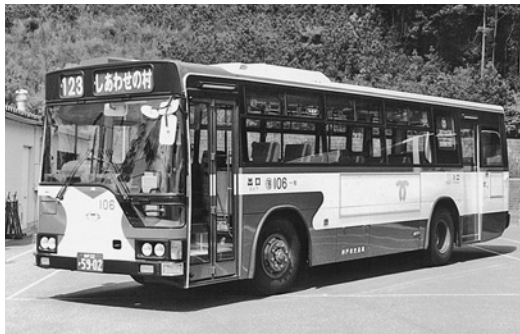
三菱KC-MP617K 平成7年式 三菱名古屋自動車製作所