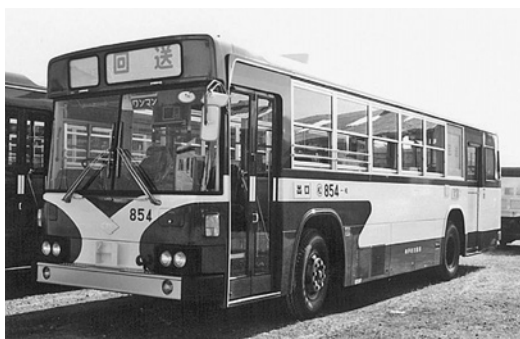
日野P-HT233BA 昭和62年式 西工車体