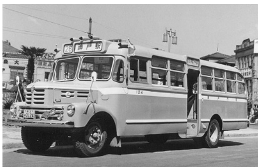
いすゞBX351 昭和31年式 61人 川崎航空機