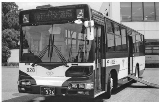
日野大型ワンステHU 2 PLEA 平成14年式 日野車体