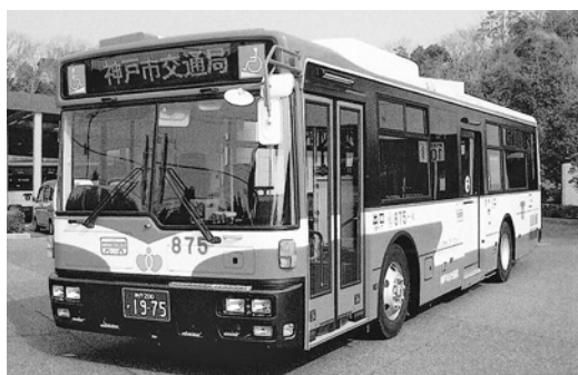
UD大型ノステRA273KAN 平成18年式 西日本車体