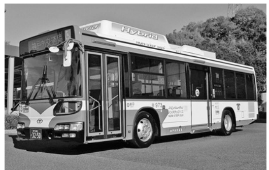
日野大型ハイブリッドノンステHU8 JLFP 平成21年式 ジェイ・バス