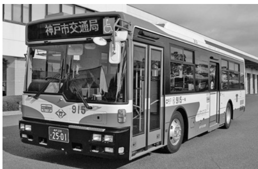
三菱大型ノンステAA274KAN 平成19年式 西日本車体