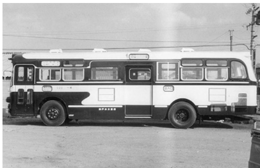
いすゞBR20 昭和40年式 西日本車体