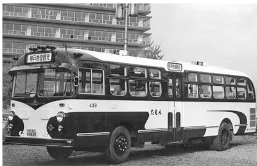
昭和31年式ふそう「たもん号」 61人乗り