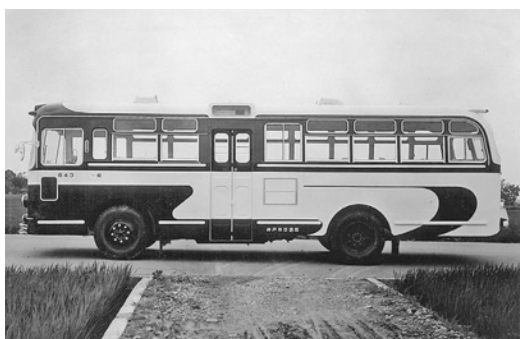
日野BT51 昭和39年式 金沢産業