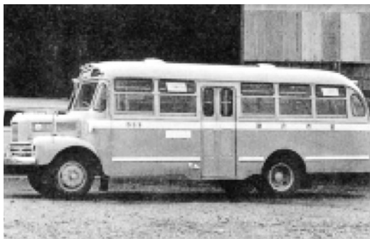
いすゞBX81 昭和27年式 49人 川崎岐阜製作所