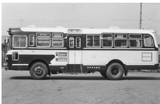
日野BT51 昭和40年式 西日本車体