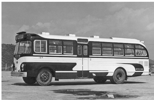
昭和32年式いすゞセミロマンス 65人乗り