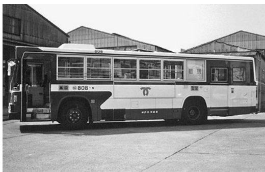
日野P-HT223AA 昭和60年式 西工車体