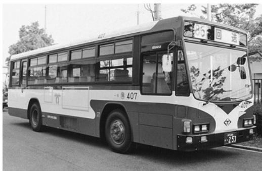
いすゞKC-LV280L 平成11年式 いすゞバス製造