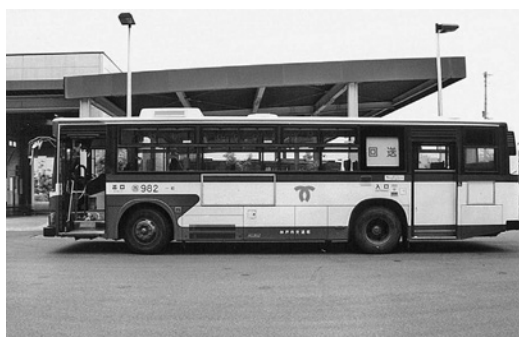
日野U-HU 3 KLA 平成6年式 日野車体 ※新ステップバス