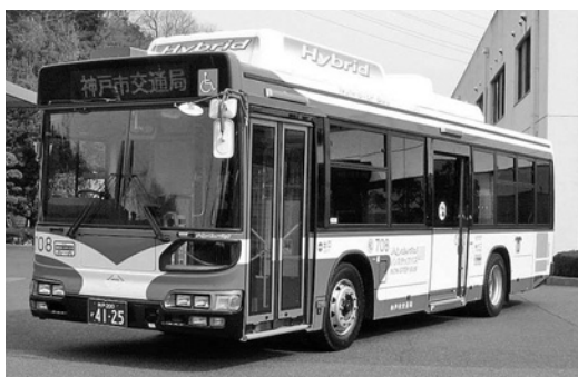
日野大型ハイブリッドノンステHU8 JLGP 平成25年式 ジェイ・バス