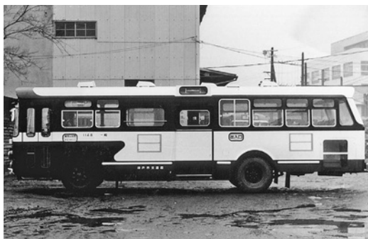
ふそうMR480 昭和42年式 西日本車体