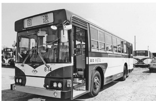
日野P-HT233BA 昭和63年式 日野車体