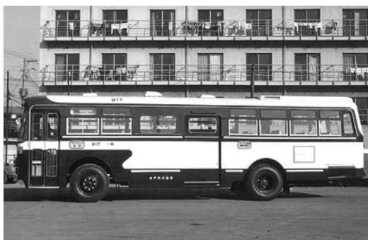
日野RE100 昭和45年式 帝国自動車