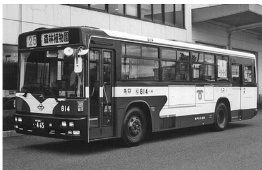
日野KC-HU 3 KLC 平成12年式 西工車体