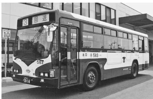
いすゞU-LV218K 平成4年式 アイ・ケイ・コーチ