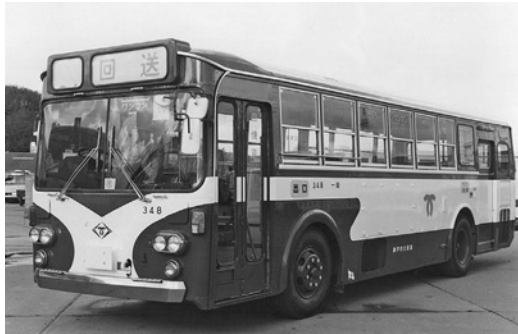
いすゞK-BU04 昭和55年式 川重車体