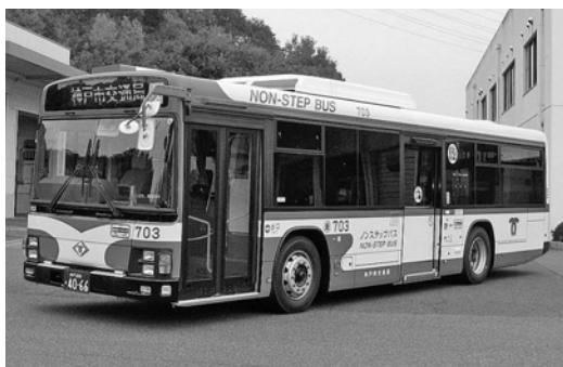
いすゞ大型ノンステLV234L3 平成24年式 ジェイ・バス