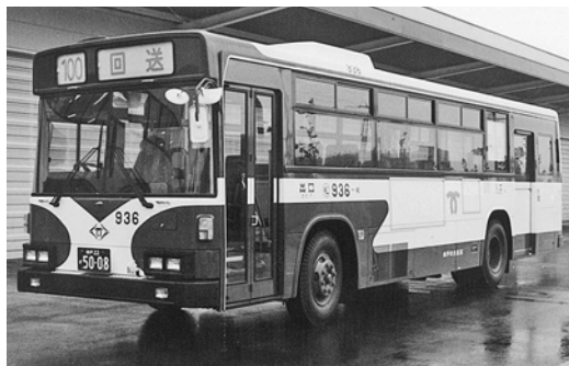
日野U-HU 3 KLAA 平成4年式 西工車体