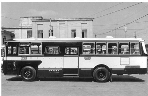
いすゞBU05 昭和44年式 川崎重工業