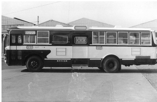
いすゞBU05 昭和41年式 川崎航空機