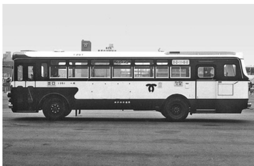
三菱MR410 昭和50年式 三菱名古屋自動車製作所