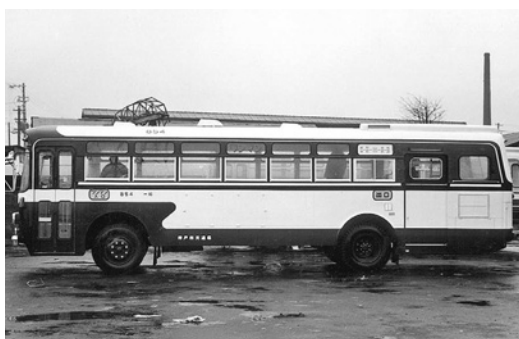
日野RE100 昭和47年式 帝国自動車