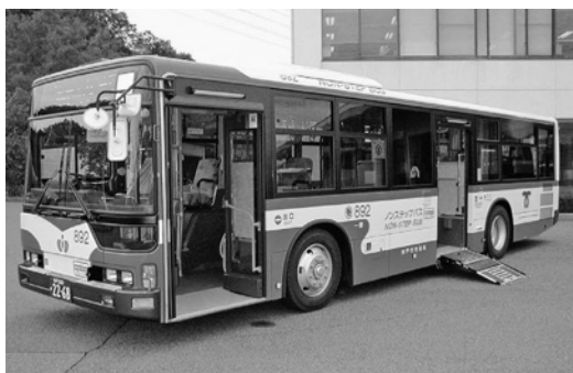
三菱大型ノンステMP37JK 平成18年式 三菱ふそうバス製造