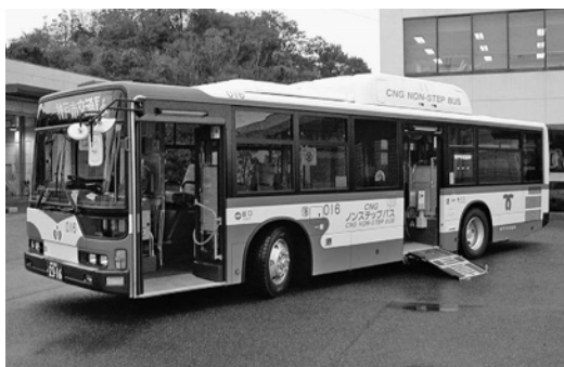
三菱大型CNGノンステMP37JK改 平成18年式 三菱ふそうバス製造