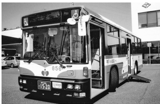
UD大型(AT)ノステUA272KAN 平成16年式 西日本車体