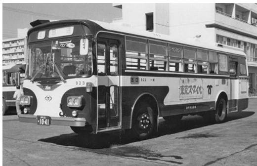
日野RE100 昭和50年式 金産自動車