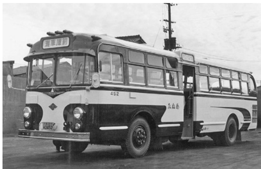
昭和33年式ふそう「みぬめ号」 62人乗り