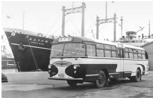
昭和30年式ふそう「ろっこう号」 61人乗り