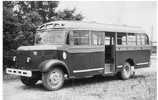
いすゞBX91 昭和25年式 47人 日国工業