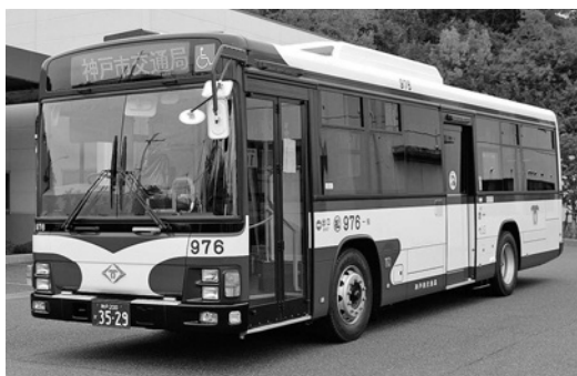
いすゞ大型ワンステLV234L3 平成22年式 ジェイ・バス