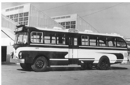
昭和35年式いすゞAC型 座席仕様