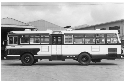
ふそうMR480 昭和40年式 三菱重工業