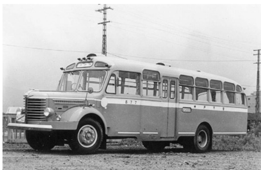
日野BH11 昭和28年式 59人 新日国工業