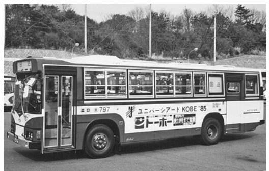
日野P-HT223AA 昭和59年式 日野車体