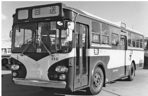
いすゞK-BU04 昭和55年式 川重車体