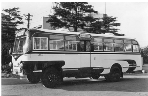
昭和33年式日野セミロマンス 63人乗り