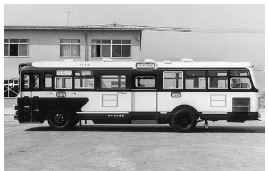
ふそうMR410 昭和43年式 呉羽自工