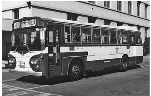
三菱K-MP118K 昭和57年式 三菱名古屋自動車製作所