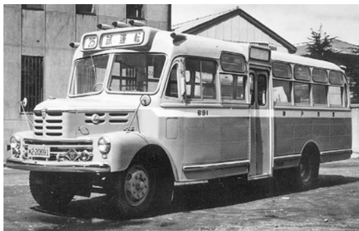
いすゞBX95 昭和30年式 55人 金沢産業