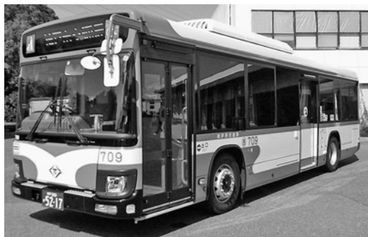
いすゞ大型ノンステLV290N2 平成30年式 ジェイ・バス