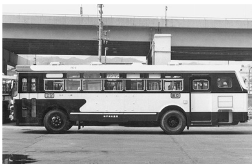
いすゞBU05 昭和46年式 西日本車体