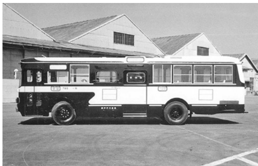
日野RE100 昭和43年式 川崎航空機