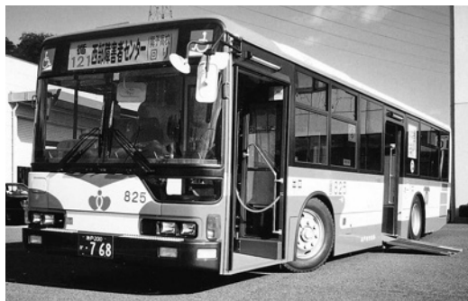
三菱大型ノンステMP37JK 平成13年式 三菱自動車バス製造