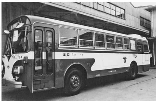
日野K-RC381 昭和56年式 日野車体