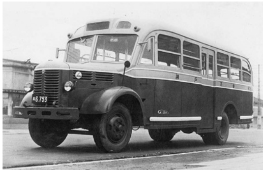
いすゞBX91 昭和23年式 43人 三菱重工業