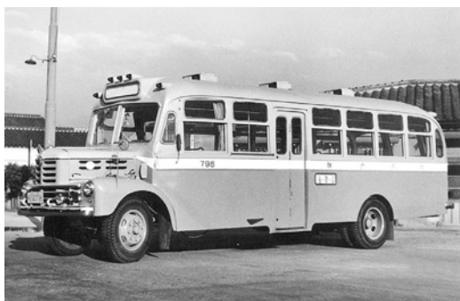
いすゞBX95 昭和29年式 54人 東浦自動車工業