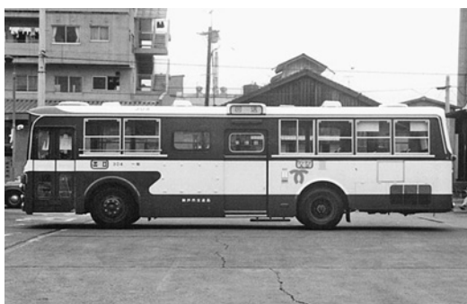
いすゞBU04 昭和51年式 川重車体