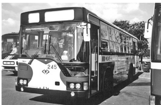
三菱P-MP218K 平成元年式 三菱名古屋自動車製作所