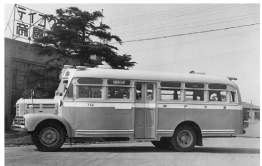
いすゞBX91 昭和27年式 49人 帝国自動車工業