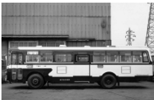
日野RE100 昭和44年式 帝国自動車