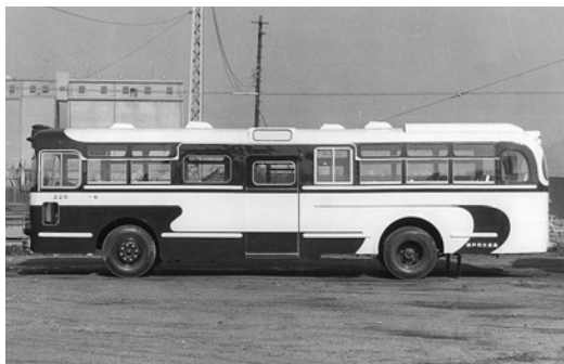
いすゞBC151 昭和37年式 川崎航空機