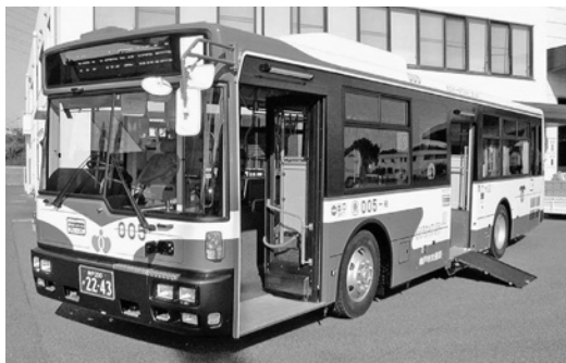
UD大型ノンステRA274KAN 平成18年式 西日本車体