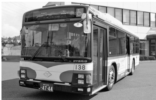
いすゞ大型ハイブリッドノンステLV234L3 平成28年式 ジェイ・バス