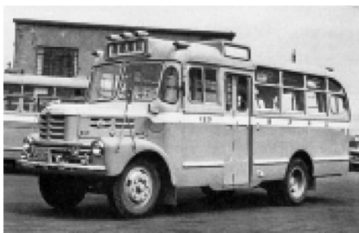
いすゞBX131 昭和31年式 36人 川崎航空機