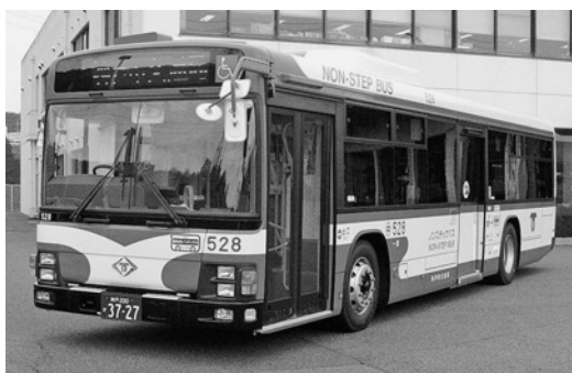
いすゞ大型ロングノンステLV234L3 平成23年式 ジェイ・バス