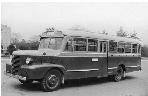
ふそうB2 昭和25年式 61人 協和機械貿易