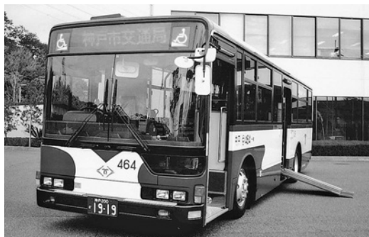
三菱大型ワンステロングMP35JM 平成17年式 三菱ふそうバス製造