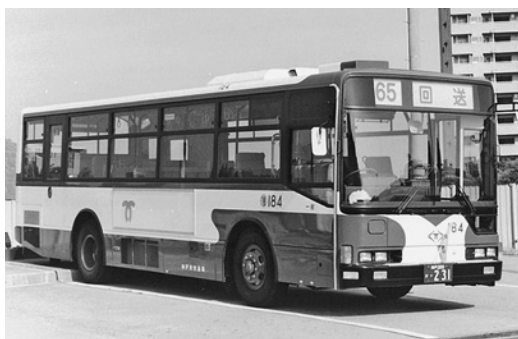
三菱KC-MP717K 平成11年式 三菱自動車バス製造