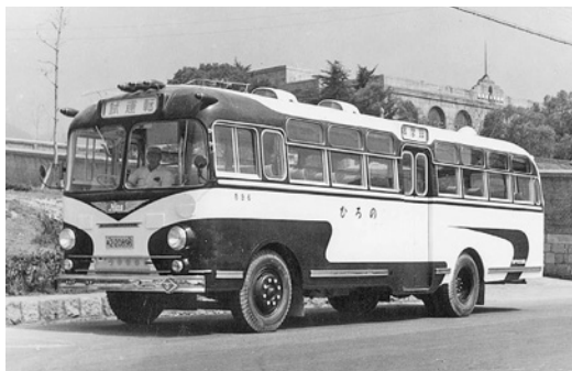
昭和30年式日野「ひろの号」 61人乗り