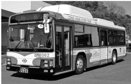
いすゞ大型CNGノンステLV234L 2改 平成21年式 ジェイ・バス