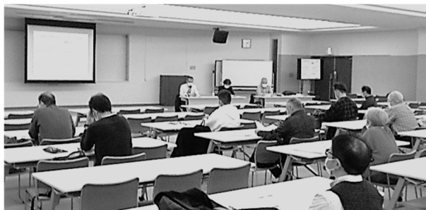
～テーマ①&②は受講必須・講義形式で実施～