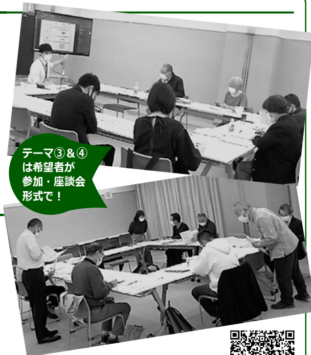
テーマ③&④ は希望者が 参加・座談会 形式で!

参加されたみなさんが運営委員長になられて1年目。そのうち事前協議の経験がない方がほとんどでしたが、事前協議の流れや方法など、おおむね理解していただけようです。