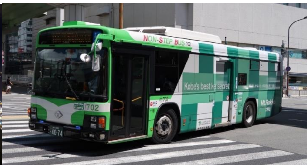
【全面ラッピングバス】