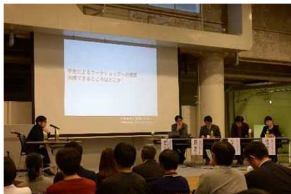
シンポジウムの様子