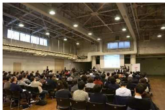
シンポジウム会場内