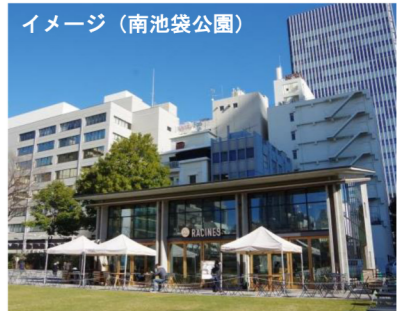
イメージ（南池袋公園）