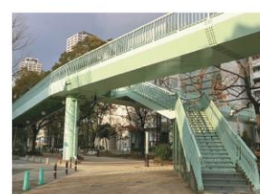
歩道端への上り口のわかりやすさ