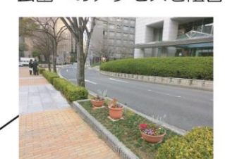
地下街からの上り口 地下街からのメインルートとして、活用を促進