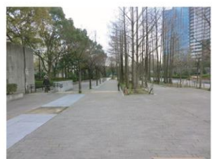
⑤公園内3本目 (噴水正面)