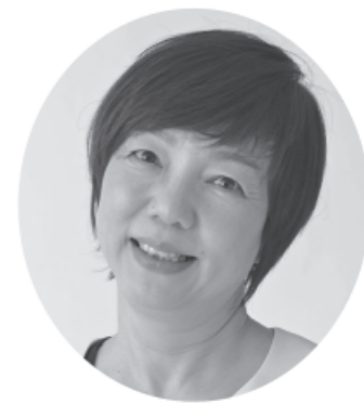
参政党公認 参議院議員候補

プロフィール 1962年生。兵庫県姫路市出身。専門学校卒業後、歯科衛生士として歯科医院勤務。結婚出産、子育てを経て2002年ケアマネジャー資格取得。2007年独立開業。現在は居宅介護支援事業所とデイサービスを営む傍ら、自身もケアマネジャーとして活動。介護予防、生涯現役への支援を目指す。