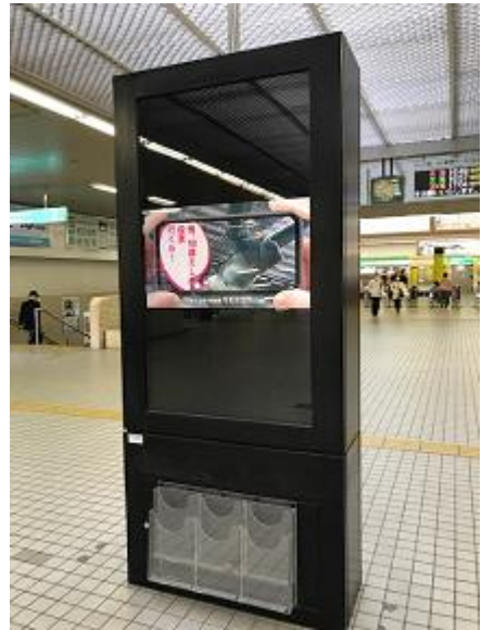
○地下鉄名谷駅デジタルサイネージ