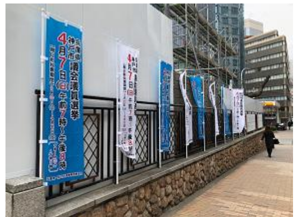
○ 市役所周辺のぼり