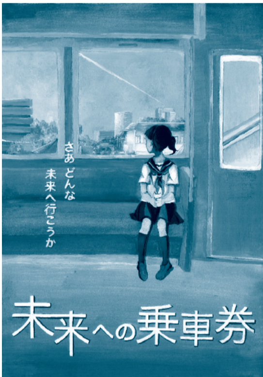
平成30年度 明るい選挙をすすめるポスターコンクール【特選】 兵庫県立兵庫工業高等学校2年 西村あゆさんの作品