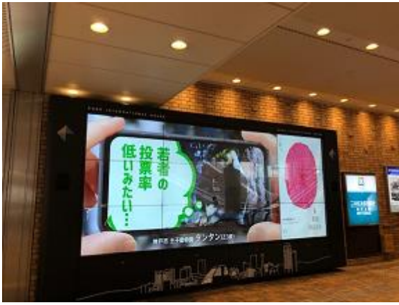
○ 神戸国際会館ビジョン