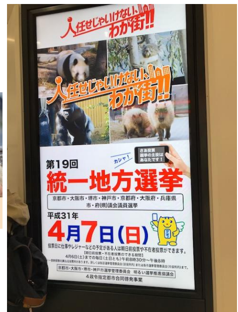
○ JR三ノ宮駅デジタルサイネージ