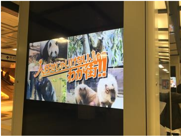
○地下鉄三宮駅デジタルサイネージ