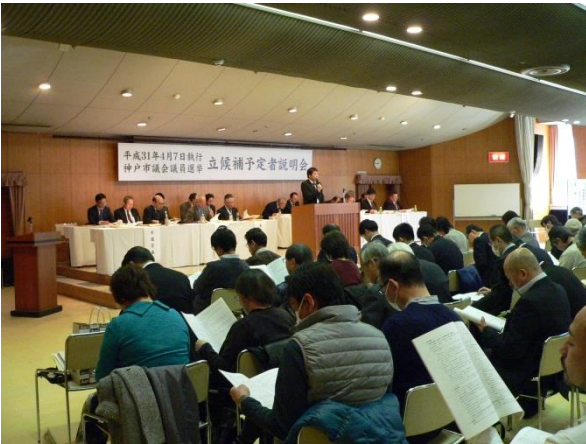
○ 立候補予定者説明会