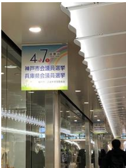
○さんちかペナント