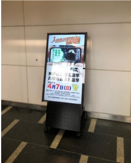
○ 市役所デジタルサイネージ