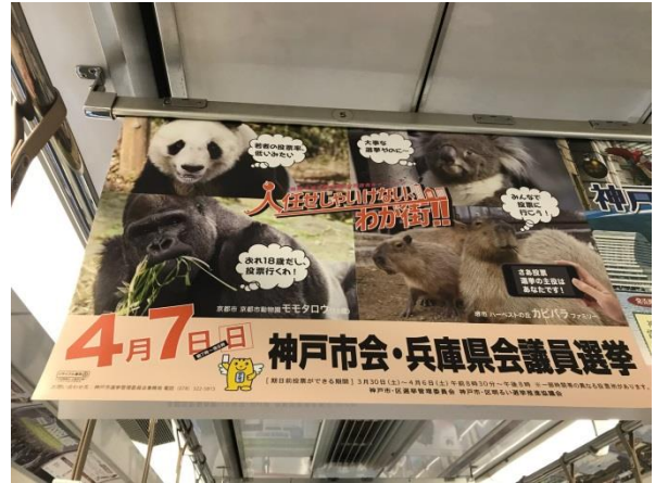
○地下鉄車内吊広告