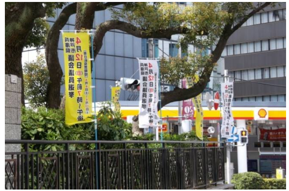
○ 市バス停留所のぼり