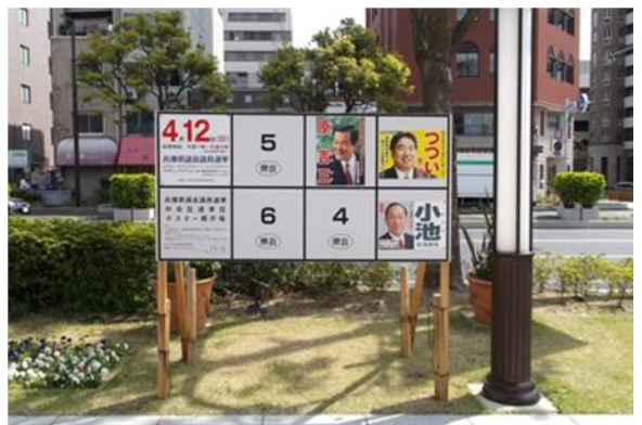
○ ポスター掲示場（県会）