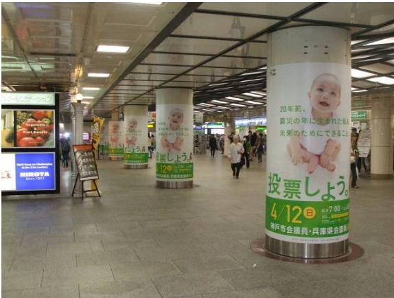
○ 地下鉄アドコラム