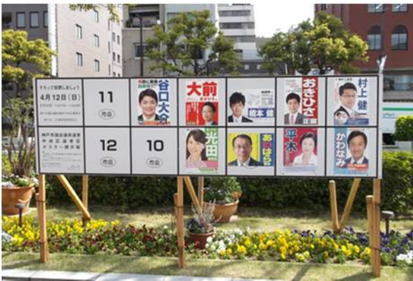
○ ポスター掲示場（市会）