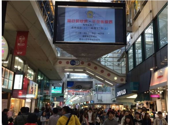
○ BOS ビジョン