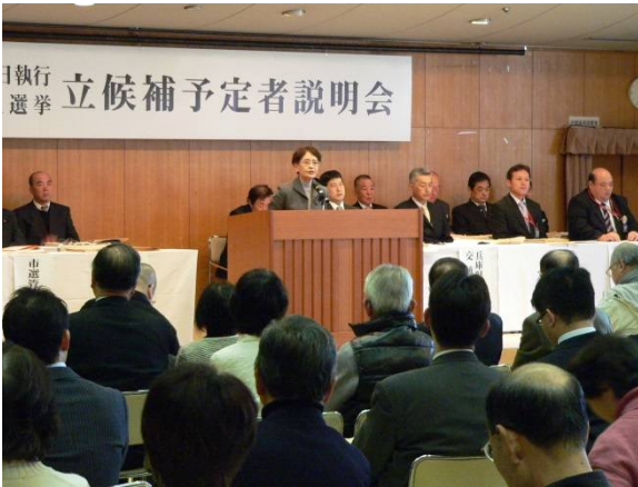
○ 立候補予定者説明会