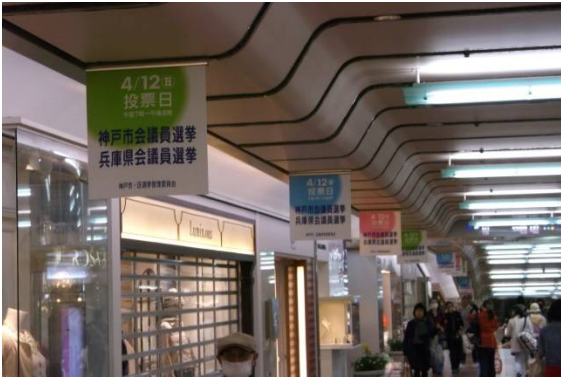
○ さんちかペナント