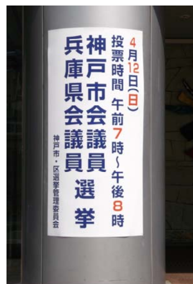
○ 交通センタービル看板