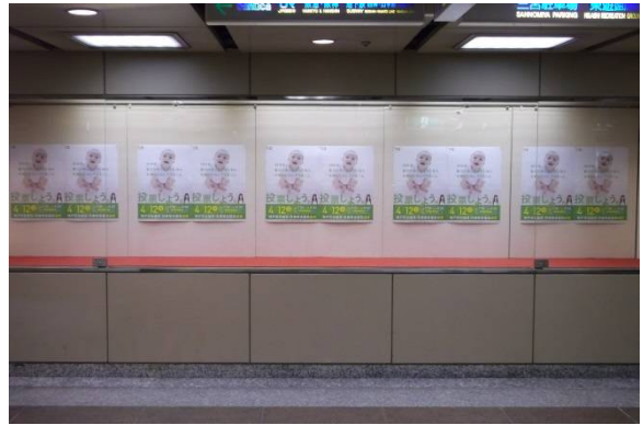
○ さんちかアドゥンドー