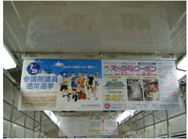
○ 地下鉄車内吊広告