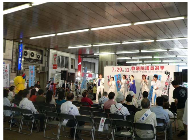
○ 県・市合同街頭啓発イベント