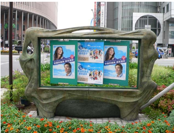
○ 掲示板「ヒューマン」