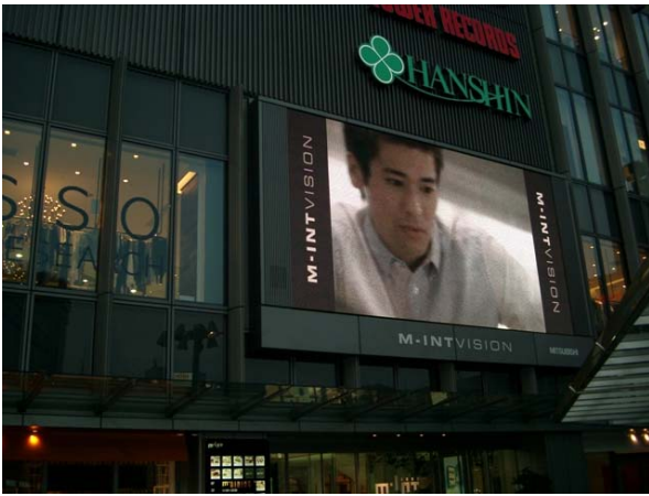
○ ミント神戸電光掲示板