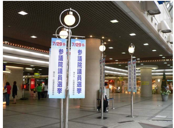
○ デュオ神戸ペナント