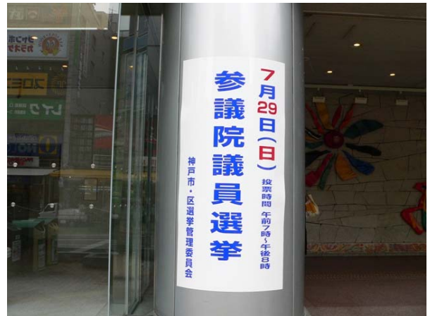
○ 交通センタービル ポスター