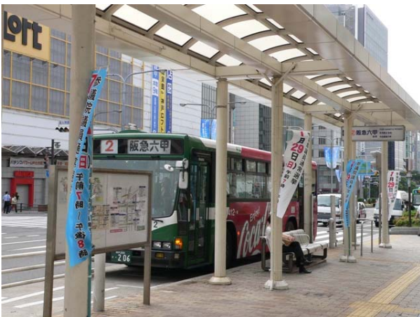
○ 市バス停留所のぼり