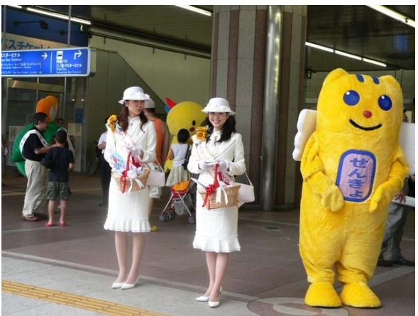
○ 県・市合同啓発イベント