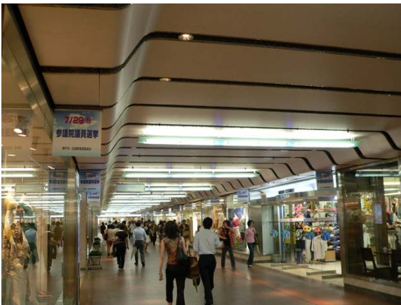
○ さんちかペナント