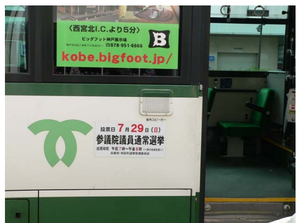
○ 市バスマグネットパネル