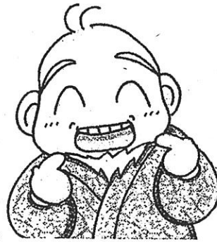
健康長寿は口から

健康調査の結果などから出された、歯・口の機能の低下を示す新しい考え方があります。