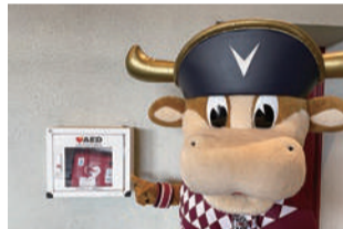
公式マスコット:モーヴィinノエスタ