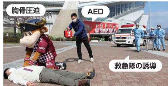
協力:ヴィッセル神戸