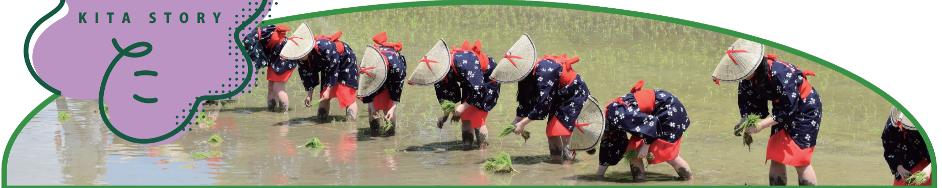
▲ KITA STORY … 6月 / 早乙女田植え (あいな里山公園)