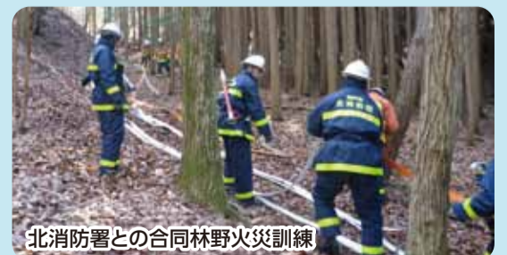
北消防署との合同林野火災訓練

区内には8つの支団(有馬・有野・山田・道場・八多・大沢・長尾・淡河)があります。火災をはじめ水害などの現場対応や各地域における安全なまちづくりのため、それぞれの地域に根ざした防災・救急訓練や、行事などの警戒にあたるなど、幅広い活動を展開しています。