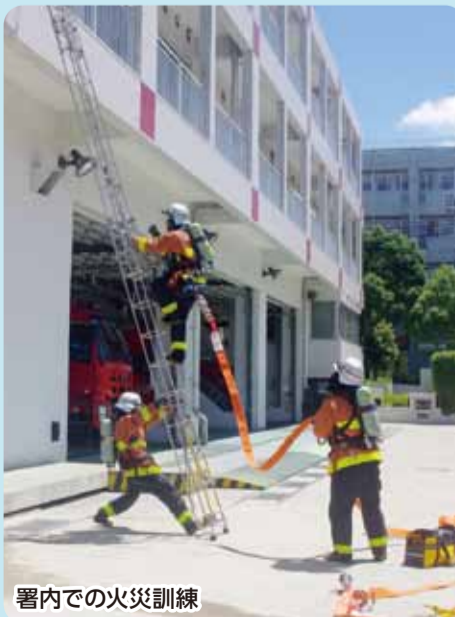
署内での火災訓練

今年のテーマは、「安全・確実・迅速」です。市内各消防署員の日頃の訓練成果をぜひご覧ください。