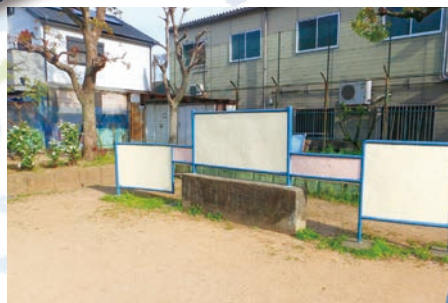
真野町にある真野公園でも、同じような遊具を発見! これも落書き板のようだ。