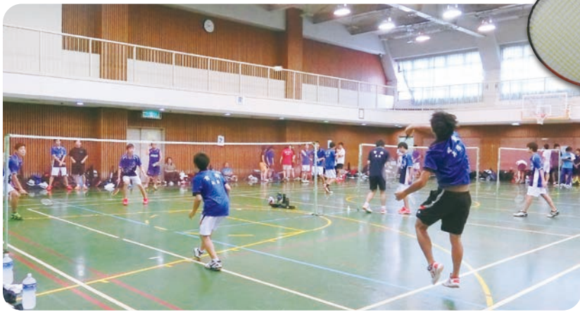
階級別トーナメントなので初心者にも優勝のチャンスあり!