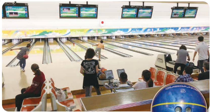
小・中学生、60歳以上、女性にはハンディキャップあり!