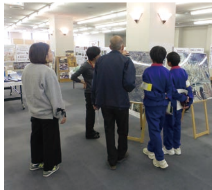
昨年の展示見学の様子