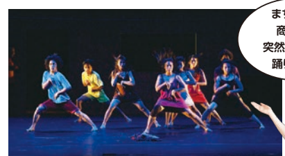
作品:©あいちトリエンナーレ2013 ジェコ・シオンボ「Terima Kos (Room Exit)」 (日本初演) 撮影:©羽島直志 写真提供:©あいちトリエンナーレ実行委員会

長田で活動している ダンスアーティストと 地元の人が新しいパ フォーマンスに挑戦。 今まで見たことない!