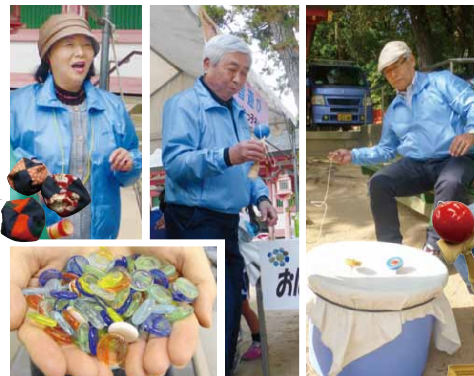
▲花水木まつりで得意な昔あそびを教えるながたっ子ネットのメンバー

子どもたちの健全育成のために、13の地域団体が協力し活動している「ながたっ子ネット」。ここでは、道徳教室の一環として『オリジナル紙芝居』や『昔あそび教室』を開催している。同会のメンバーは「長田の子どもたちは、ほんとうに人懐っこい。そんな子どもたちを応援したい。例えば、自転車でもちを走る子どもたちに、自転車を利用するためには駐輪マナーも守ってね。そうすれば、まわりの人たちに迷惑もかけずに、自分たちも楽しく遊べるよ」と伝えたくて、ストーリーを考えて作ったのが紙芝居「自