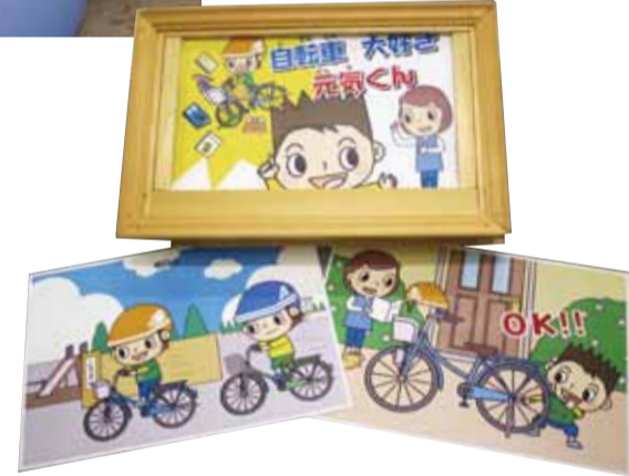
▲ながたっ子ネットが独自でストーリーを考え、作成した紙芝居『自転車大好き元気くん』