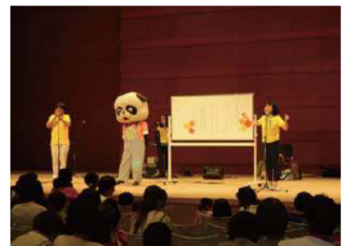
ファミリーコンサートの様子

ユースステーション北神に併設されているキッズステーションの有効活用が図れ、地域に根ざした子育て支援の啓発につながる。