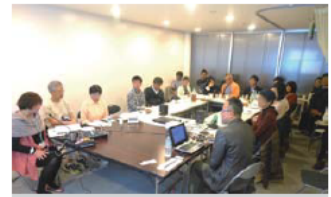
連続講座第2回 「いま隣にある”難民問題”」