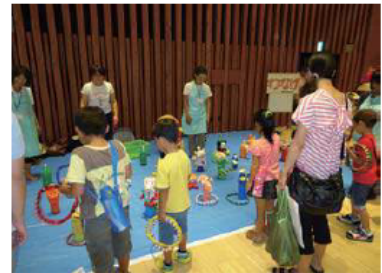
主任児童委員による輪投げコーナーの様子

今回は、参加者のアンケート、協働の効果をご紹介するとともに、協働するNPO法人の方からコメントをいただきました。