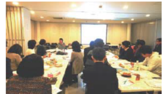
連続講座第3回 「外国人技能実習制度と定住化の流れ」