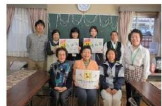
自治会への出前カフェ