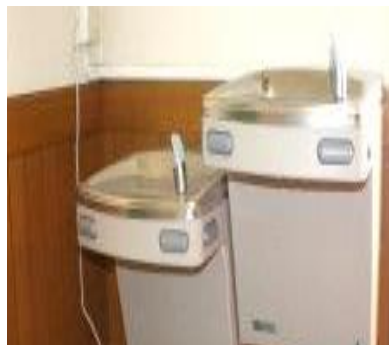
二連式ウォータークーラー