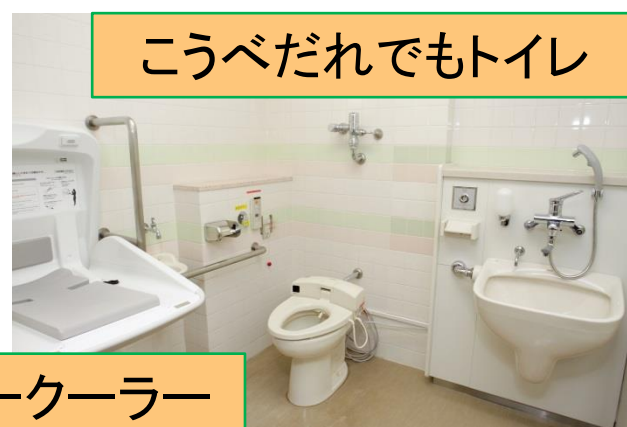
こうべだれでもトイレ