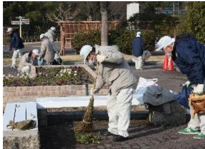
障がい者の就労支援