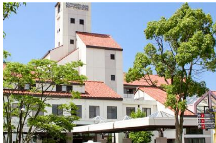
神戸リハビリテーション病院