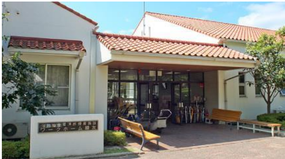
ワークホーム緑友 (社福)新緑福社会