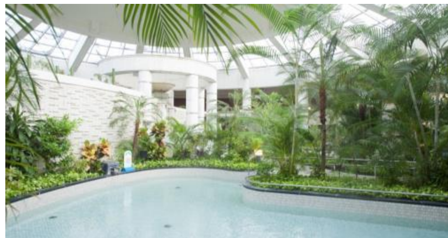
温泉健康センター