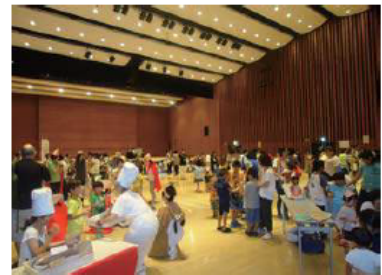
イベントコーナーの様子