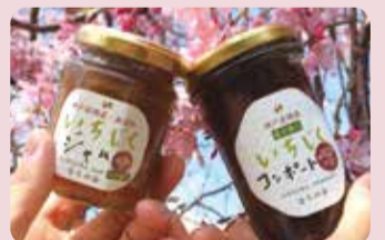
(左)いちじくジャム、(右)コンポート