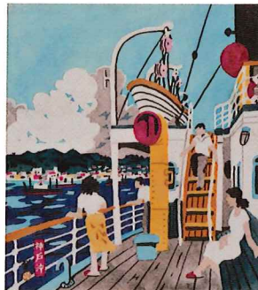
川西英「新神戸百景」より《神戸沖》 1952～61年 水彩・紙 神戸ゆかりの美術館