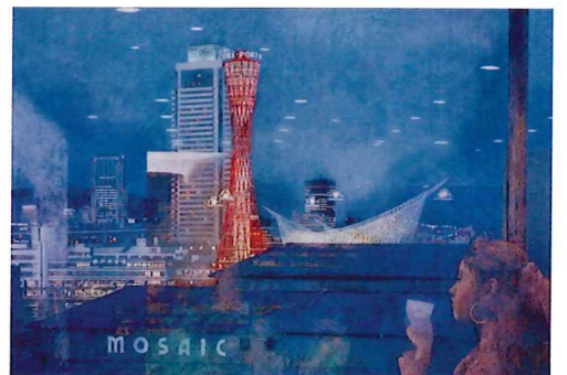
西田真人《暮れゆく街》 1993年 紙本著色 神戸市立博物館