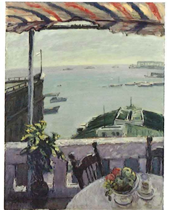
川端謙次《湖風》 1955年 油彩・キャンバス 神戸市