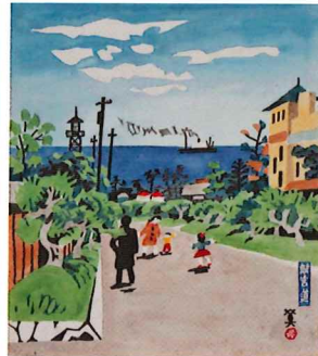
川西英《離宮道》 1952～53年 水彩・紙 個人蔵