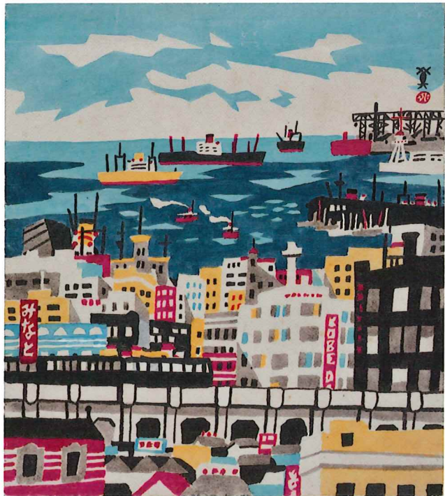
川西英「新神戸百景」より《みなと》 1952～61年 水彩・紙 神戸ゆかりの美術館