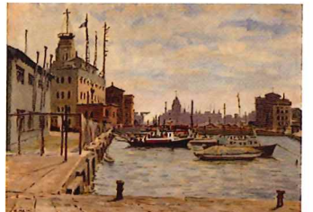
桐井一夫《メリケン波止場より》 1953年 油彩・キャンバス 神戸市立博物館