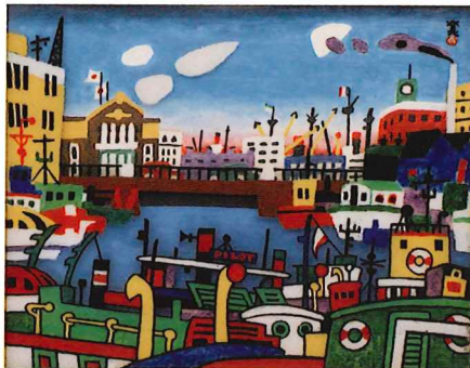
川西英《メリケン波止場》 アクリル・ミクストメディア 1964年頃 神戸市立博物館