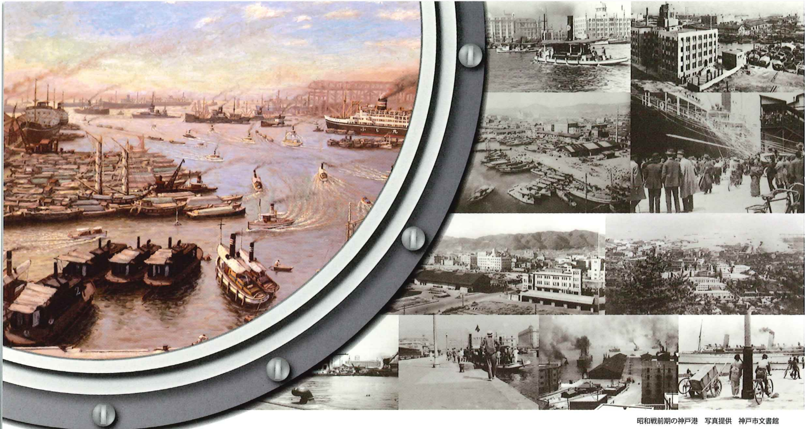
昭和戦前期の神戸港