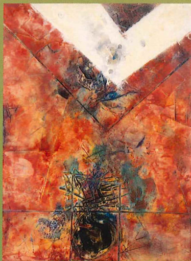
田中徳喜《こわされた空》 1965年 油彩・樹脂・キャンパス 当館蔵