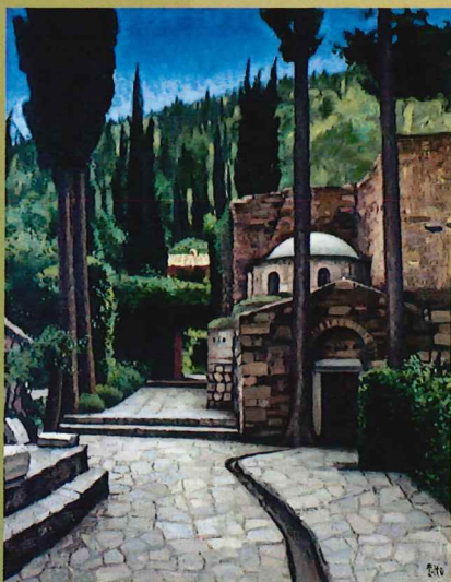
伊藤慶之助《僧院ケサリアニ》 1968年頃 油彩・キャンパス 当館蔵