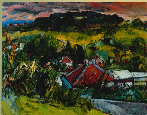
山本萬司《沖繩》1975年頃 油彩・キャンパス 当館蔵