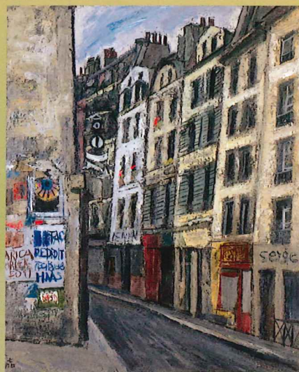
元川嘉津美《ギャランド街》 1980年 油彩・キャンパス 当館蔵