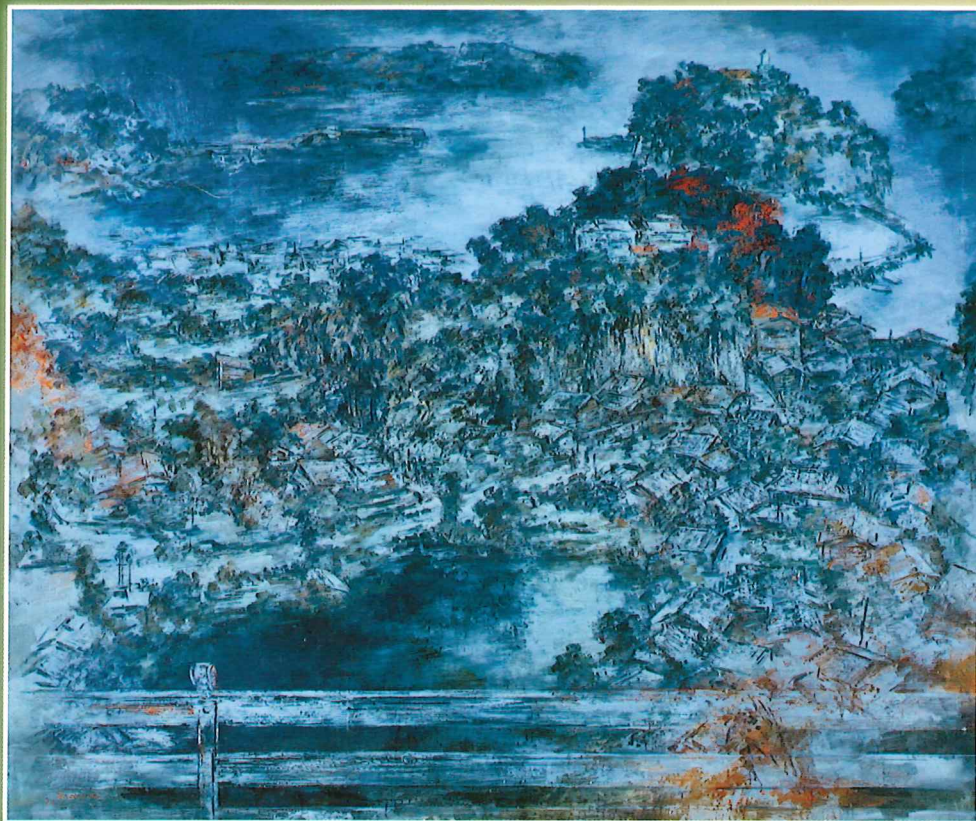
長尾和《橋の島かげ (与島)》1990年 油彩・キャンバス 当館蔵