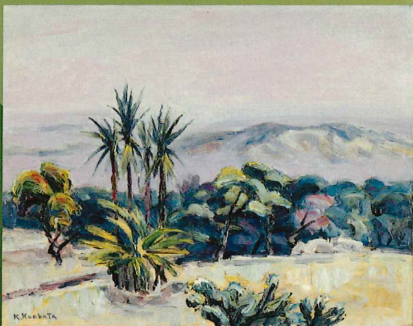
川端謹次《六麓荘風景》1958年〜59年頃 油彩・キャンパス 当館蔵