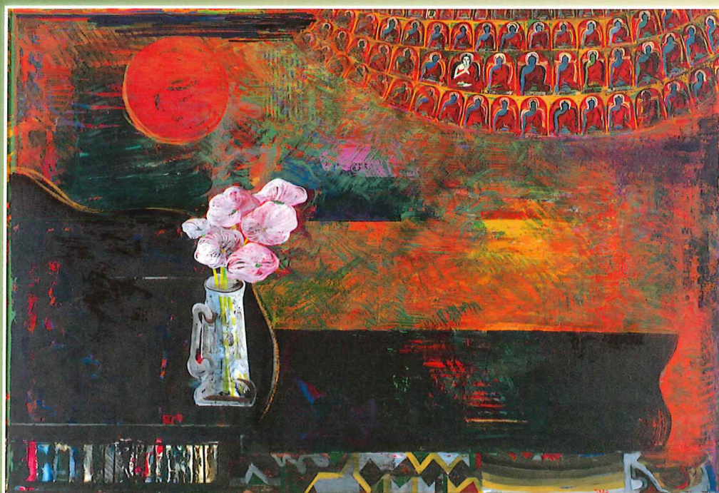
角卓《艶景 (宝の華)》1986年 油彩・キャンバス 当館蔵