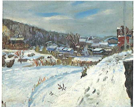
小松益喜《葦葦き風景(3) (雪)》1984年頃