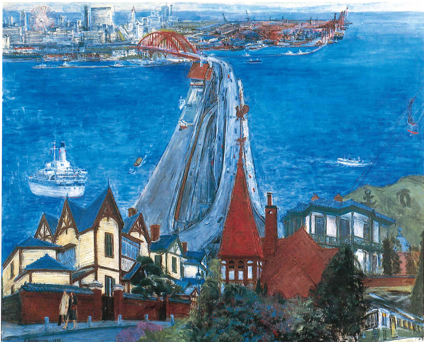
西村 功《ポートアイランドと神戸》1990年